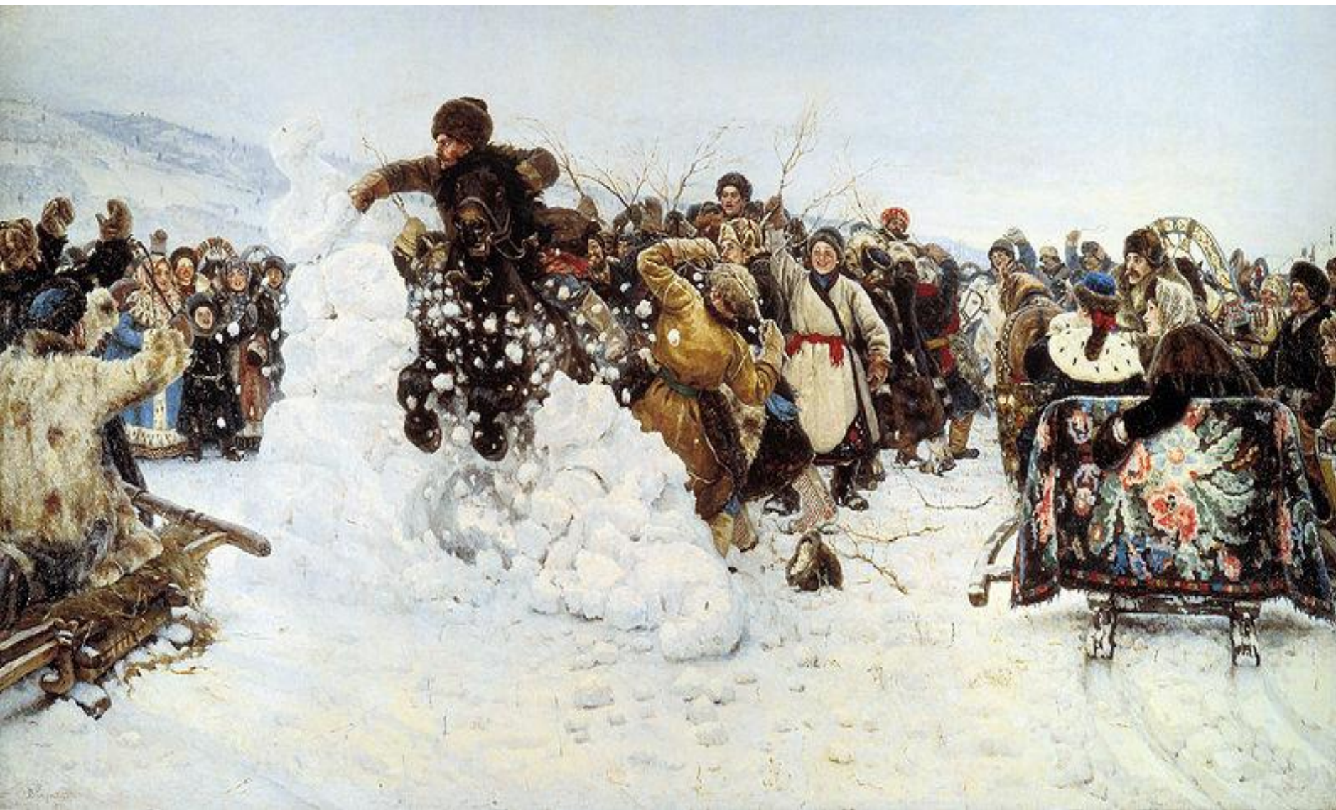
В. Суриков «Взятие снежного городка»