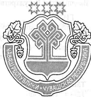
Государственный герб Чувашской Республики

2. Запиши, что означают цвета и изображения на флаге и гербе.