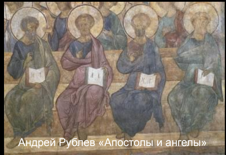
Андрей Рублев «Апостолы и ангелы»

Любят поспать, поесть Делят место возле Иисуса на небесах