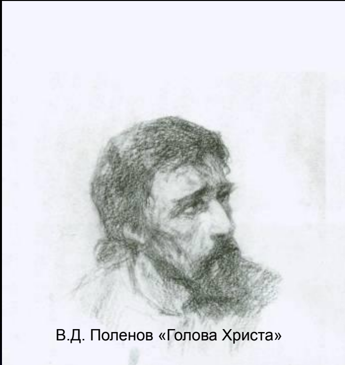
В.Д. Polenov «Голова Христа»

Христос — воплощение добра, красоты, истины.