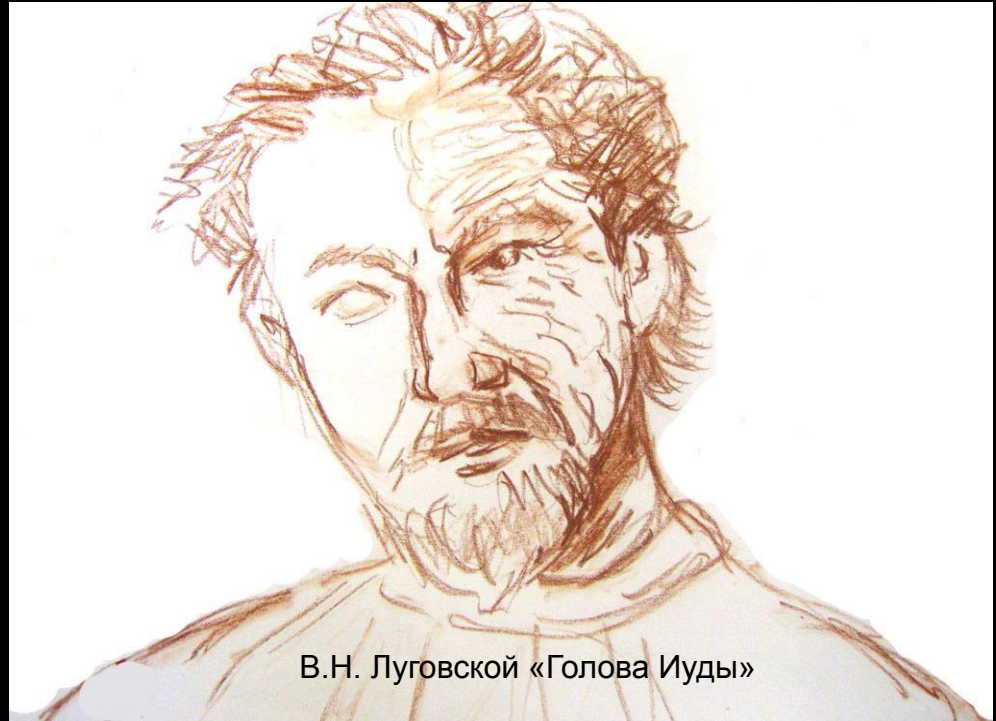
В.Н. Луговской «Голова Иуды»

Христос — воплощение добра, красоты, истины.