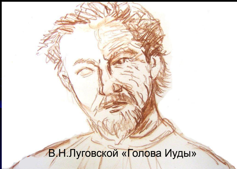
В.Н.Луговской «Голова Иуды»

Старается стать нужным Превосходит силой своей любви к Иисусу