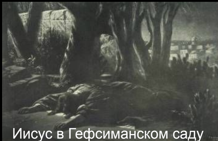
Иисус в Гефсиманском саду