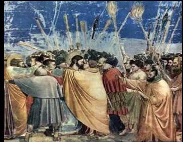
Джотто «Поцелуй Иуды»