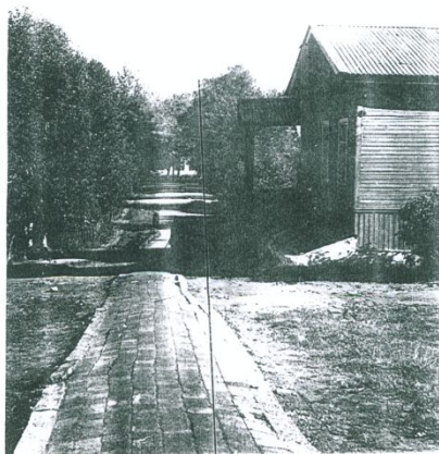
4-ое здание школы № 2 сентябрь 1977