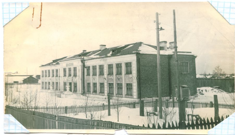
5 здание школы № 2