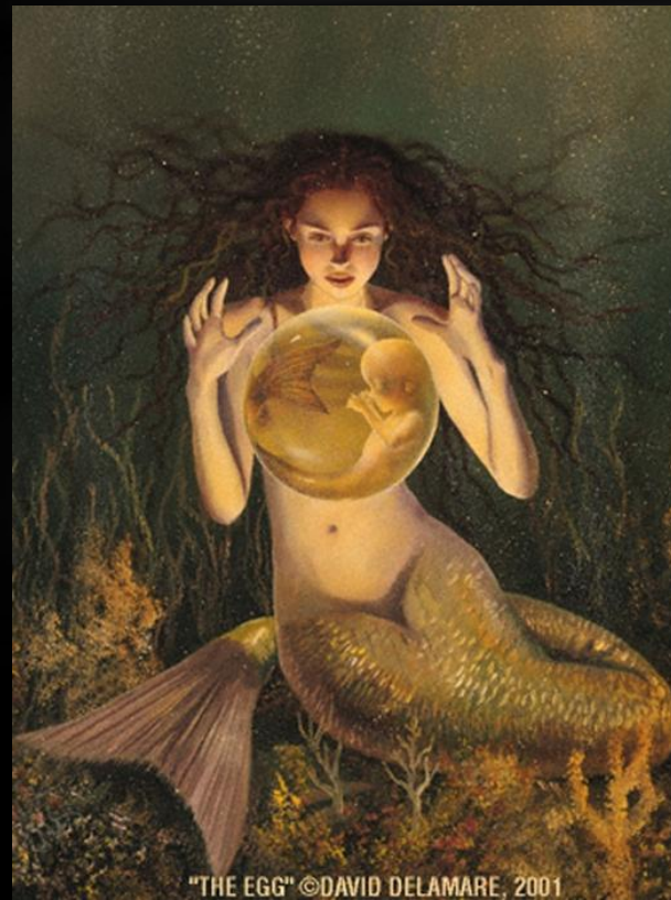
"THE EGG" ©DAVID DELAMARE, 2001

Дети являются постоянным объектом преследований и вредоносных действий РУСАЛКИ, которая наказывает их за внеурочное появление в цветущем ржаном поле, гоняется за ними, щекочет, душит своей «железной цыцкой». похищает. «Не ходи в жито,— угрожали на Воляни детям в период Русальной недели,— а то русалка заставит тебя нянчить своего ребенка». О детях, погибших и умерших на Русальной неделе, в Полесье говорили: «Русалки забрали к себе».