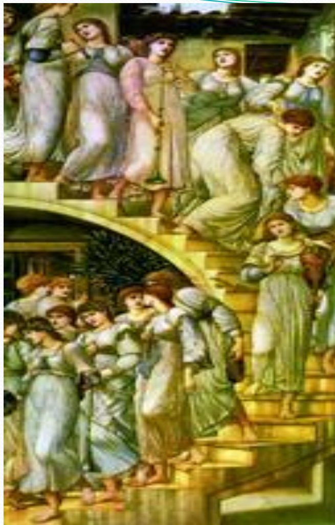
Э. К. Бёрн-Джонс. Золотые ступени. 1880