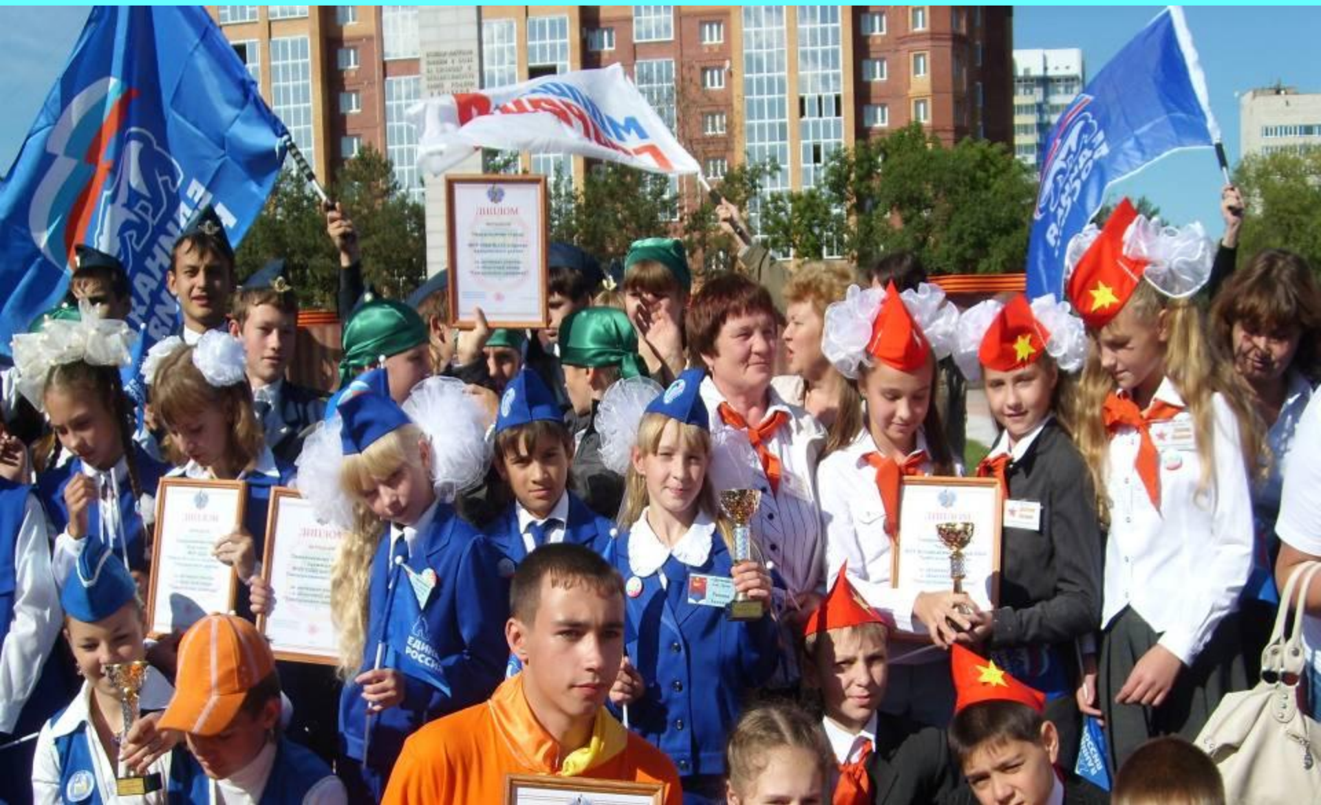
Фото на память!