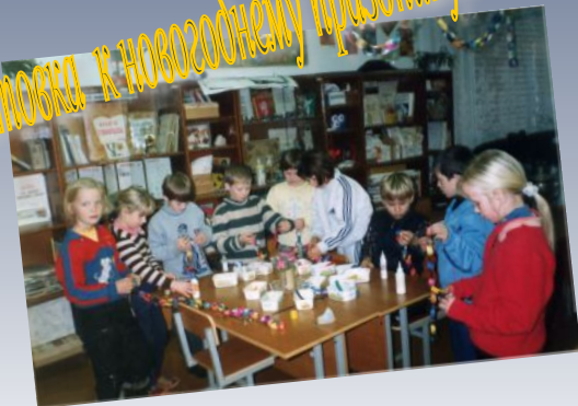
Дружная подготовка к новогоднему празднику.