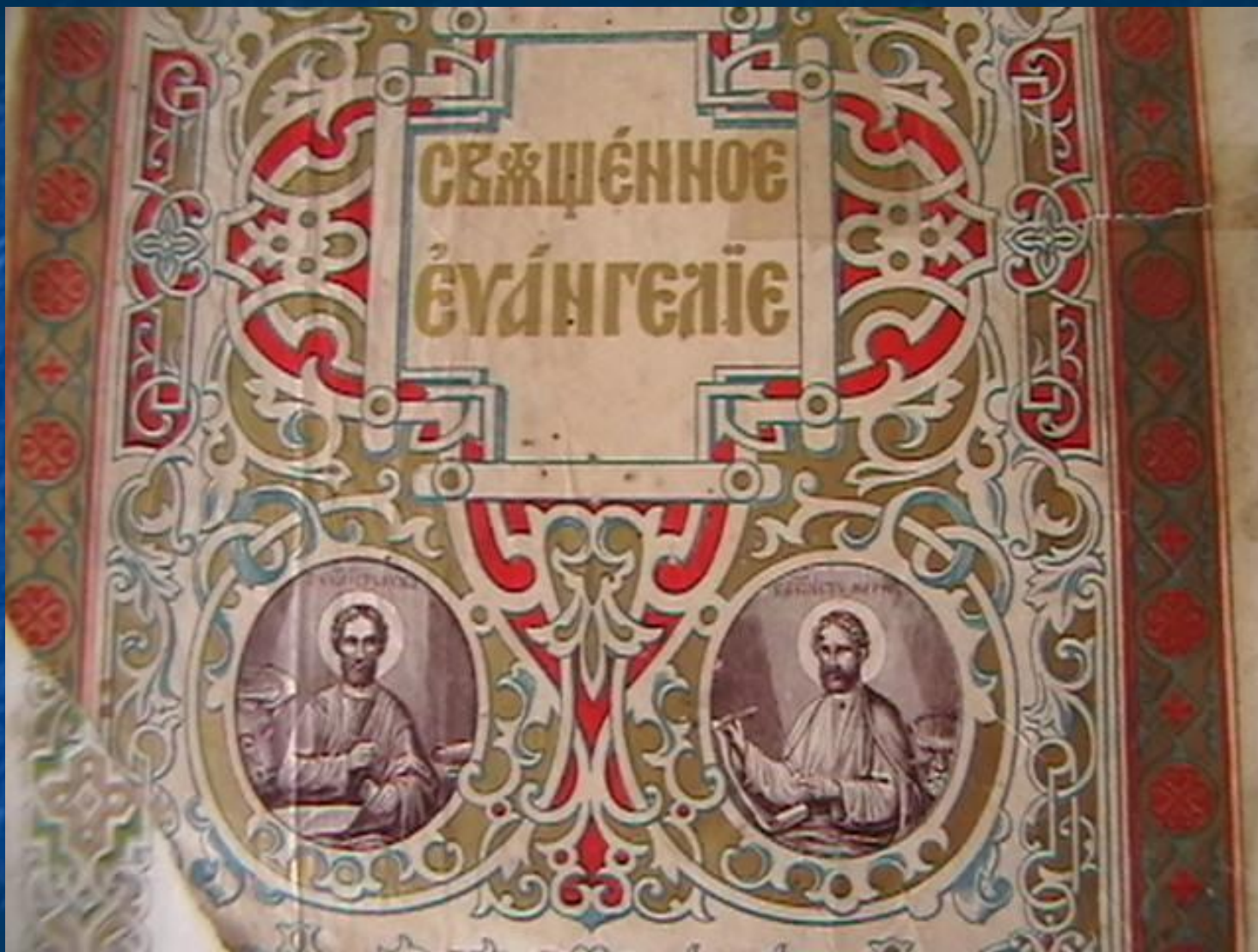
Нижняя часть титульного листа книги