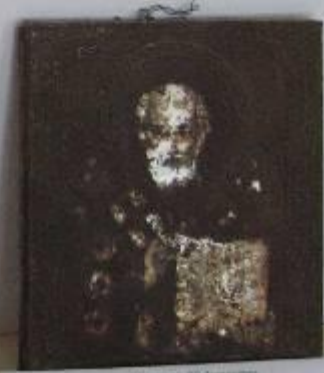
Церковная утварь (Икона / Крест)