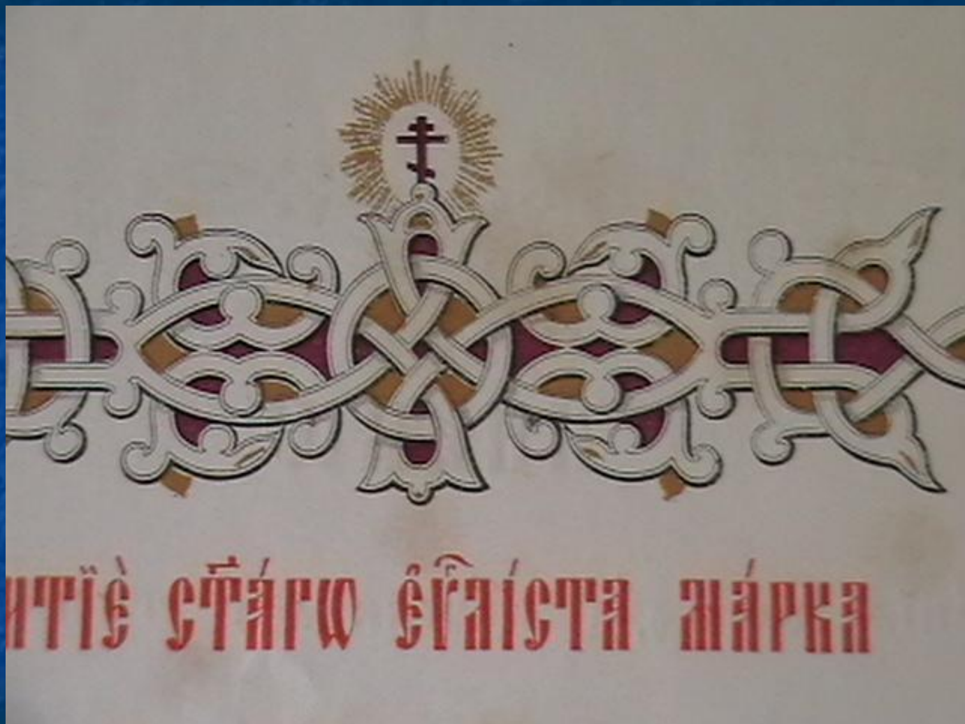
Рисунки и шрифт книги