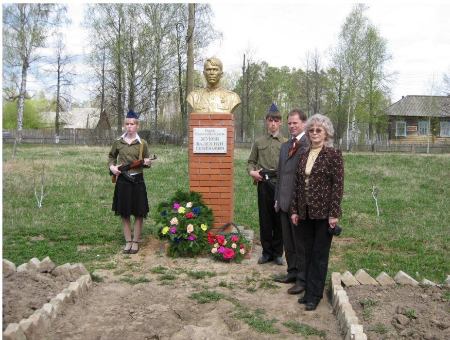
Открытие памятника Герою Советского Союза Жукову В.С.