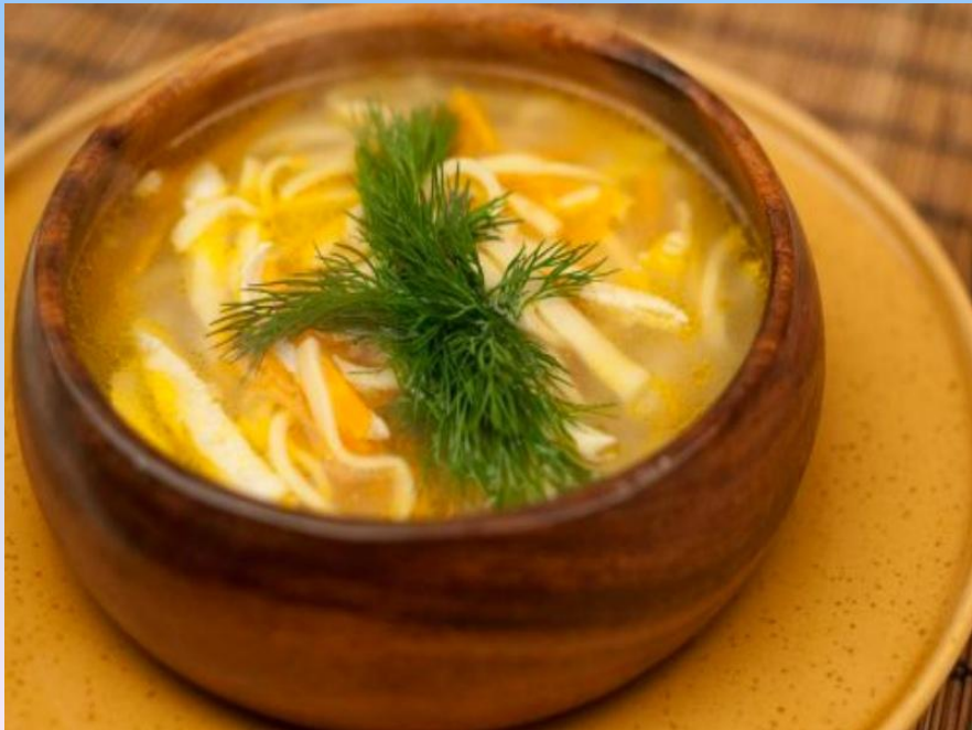
суп с лапшой