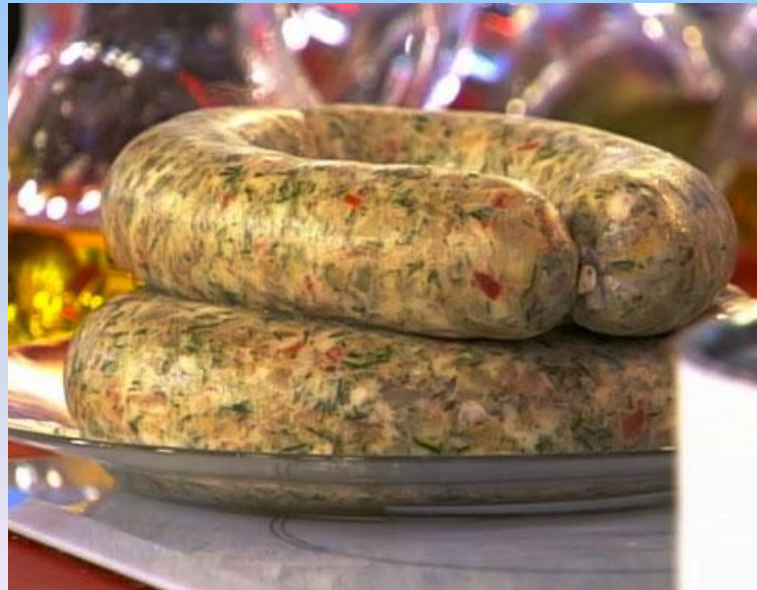
домашняя отварная колбаса