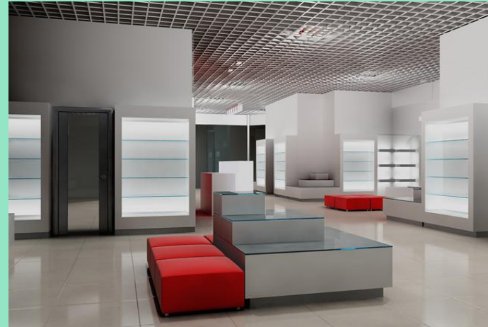
Интерьер магазина обуви «Respect» - Традиционный минимализм