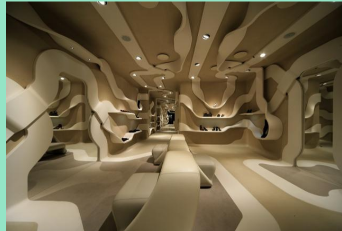
Дизайнер интерьера – Fabio Novembre. Основной мотив – тема «шнурков»