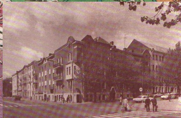
Здание управления Либаво-Роменской ж.д.