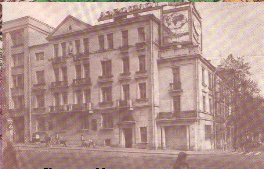
ул. Карла Маркса, 30