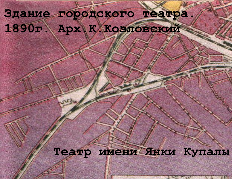
Театр имени Янки Купалы