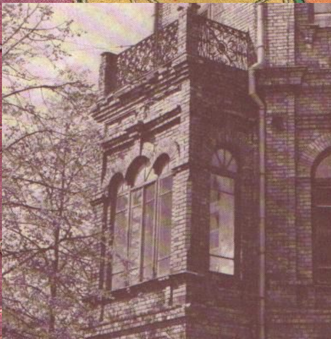
Дом народной милиции