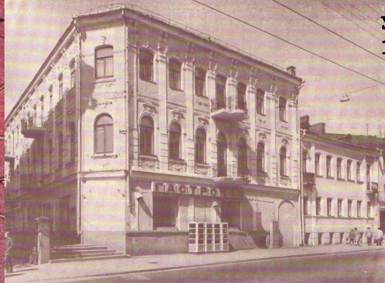
ул. Володарского, 12