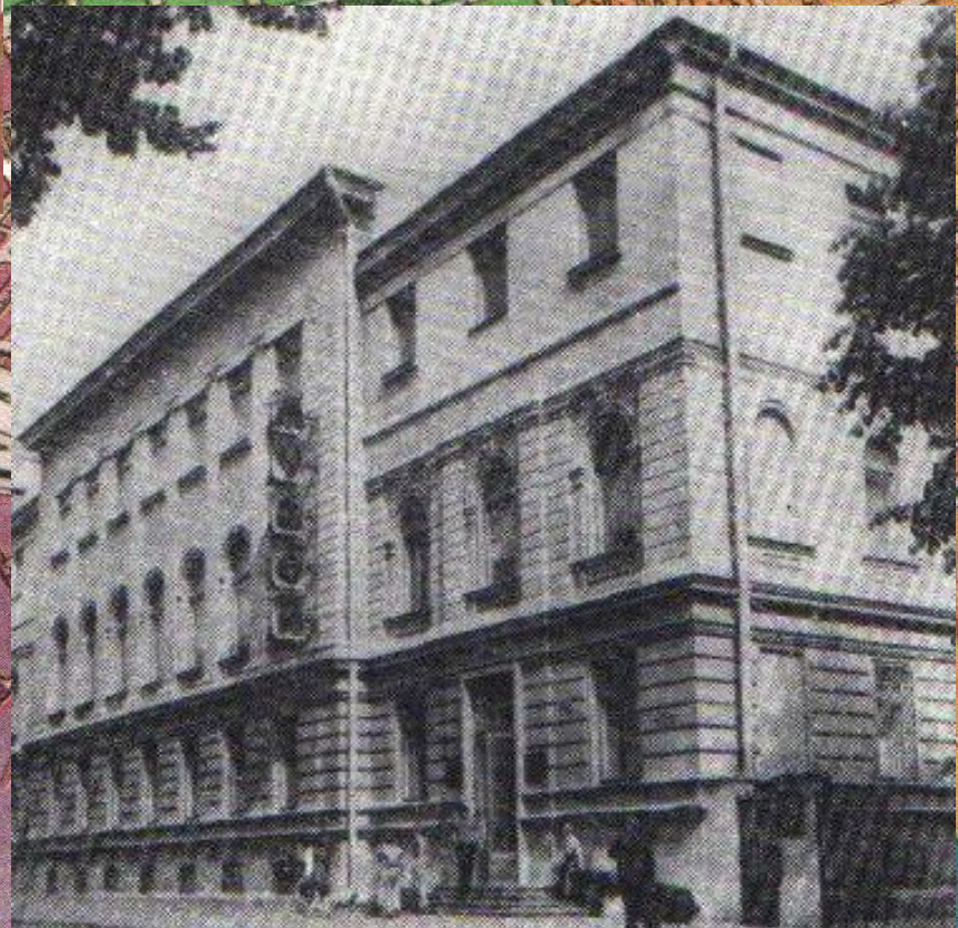
Государственный музей РБ