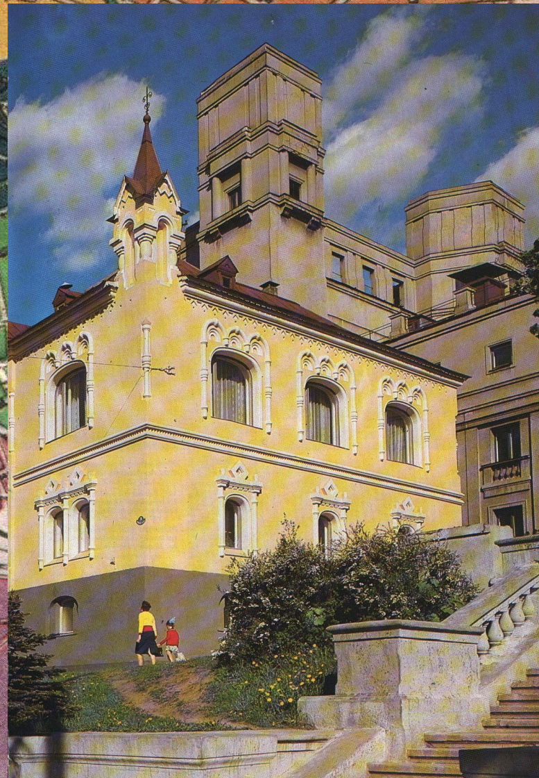
Здание церковно-археологического музея. 1913. Арх. В.И. Струев.