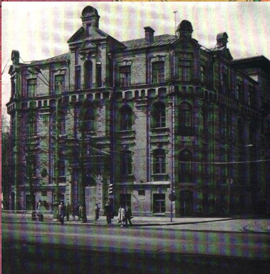
Здание женской гимназии.