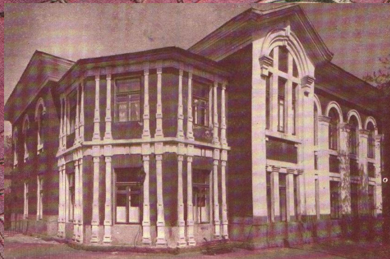
Здание ж.д. больницы