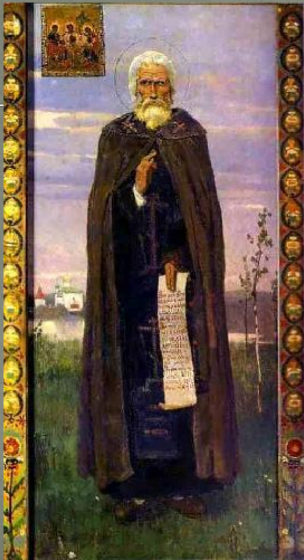
В.М. Васнецов Сергий Радонежский