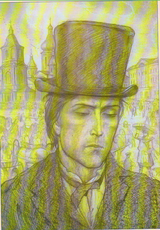
И.Глазунов. Иллюстрация к роману Ф.М.Достоевского «Преступление и наказание». 1986

и Базаров: МОЖНО ЛИ СТРОИТЬ ЖИЗНЬ ПО ТЕОРИИ?