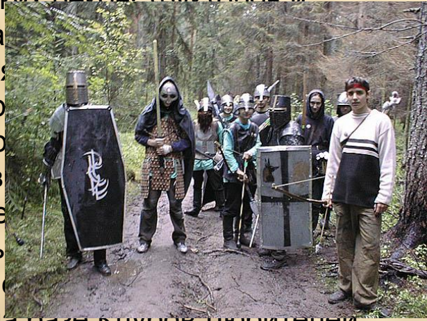
Ролевое движение в России и СССР возникло в 80-е годы на базе клубов любителей

Кроме ролевых игр, ролевики собираются на Ролевые Конвенты — кратковременные