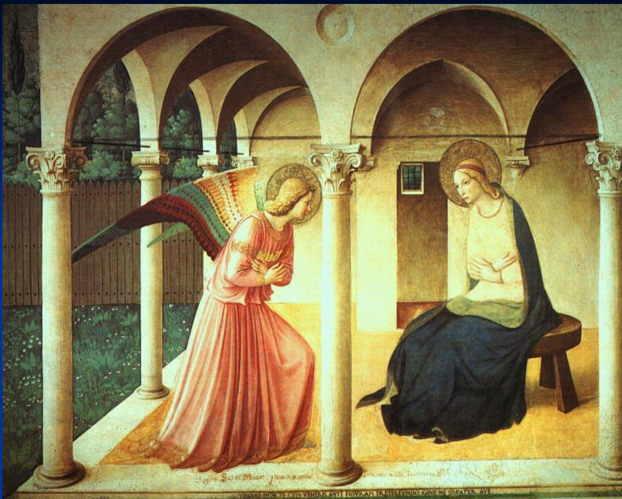
Фра Анджелико. 1450. Музей Сан-Марко. Флоренция