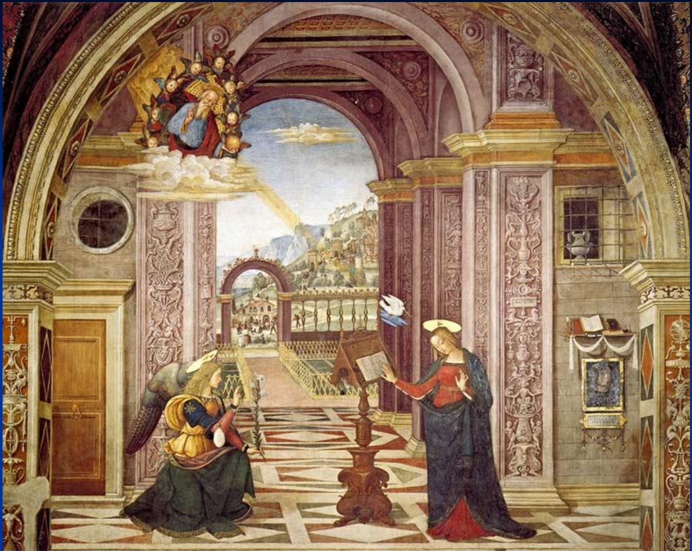
Пинтуриккьо. 1551. Благовещение. Перуджа, церковь Санта-Мария Маджоре