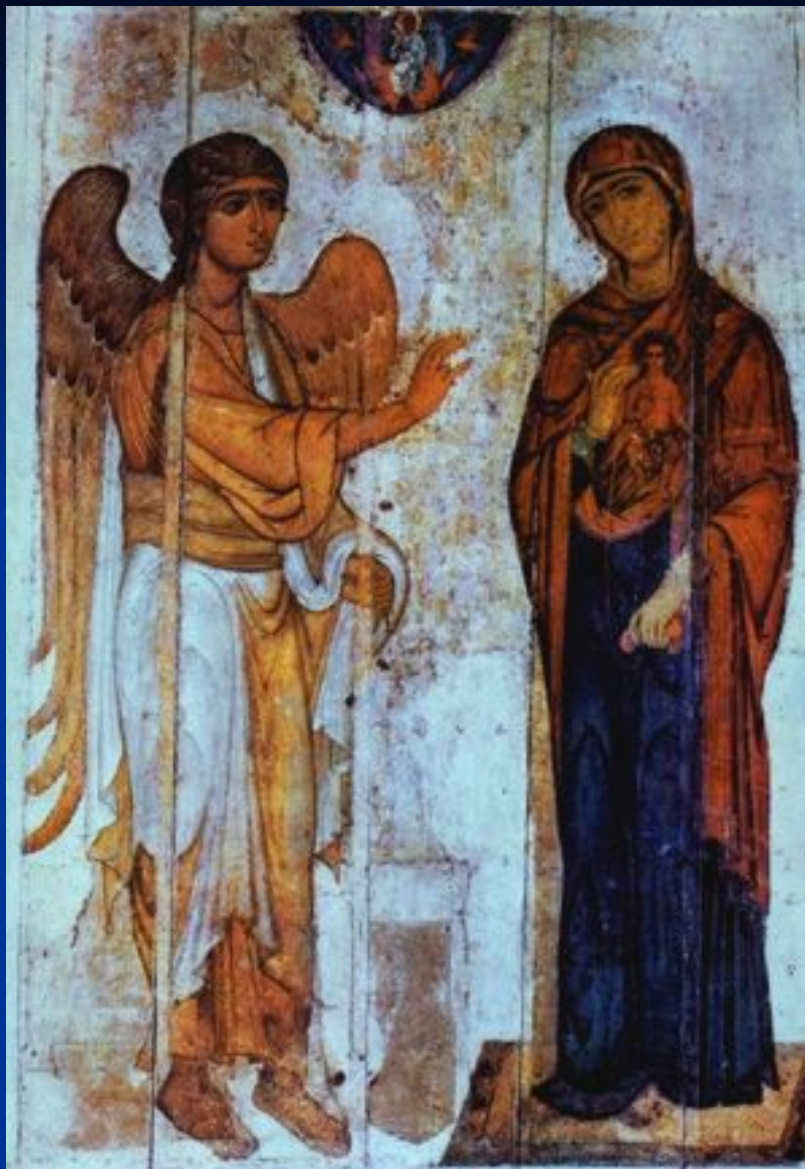
Устюжское Благовещение. Великий Новгород .XII век (ГТГ)