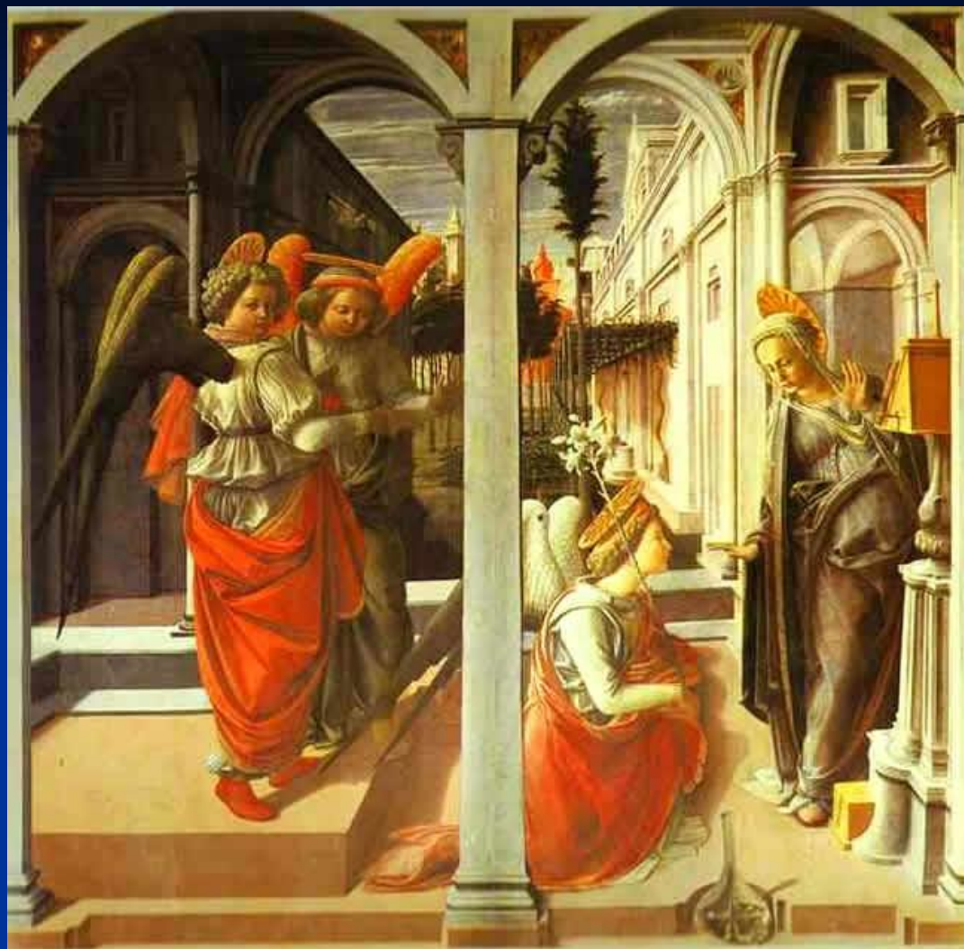
Фра Филиппо Липпи. Благовещение. 1442. Сан Лоренцо. Флоренция.