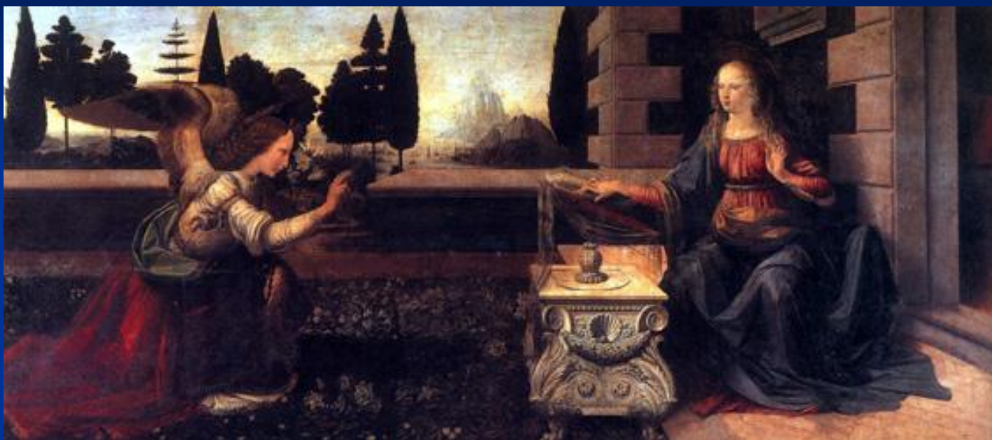
Леонардо Да Винчи. Благовещение. Уффици 1472-75