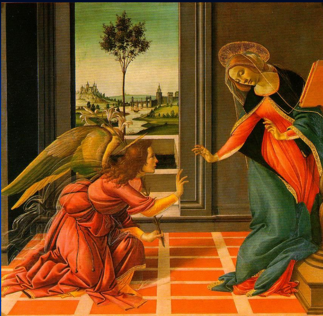
Боттичелли. Благовещение. 1489. Уффици. Флоренция