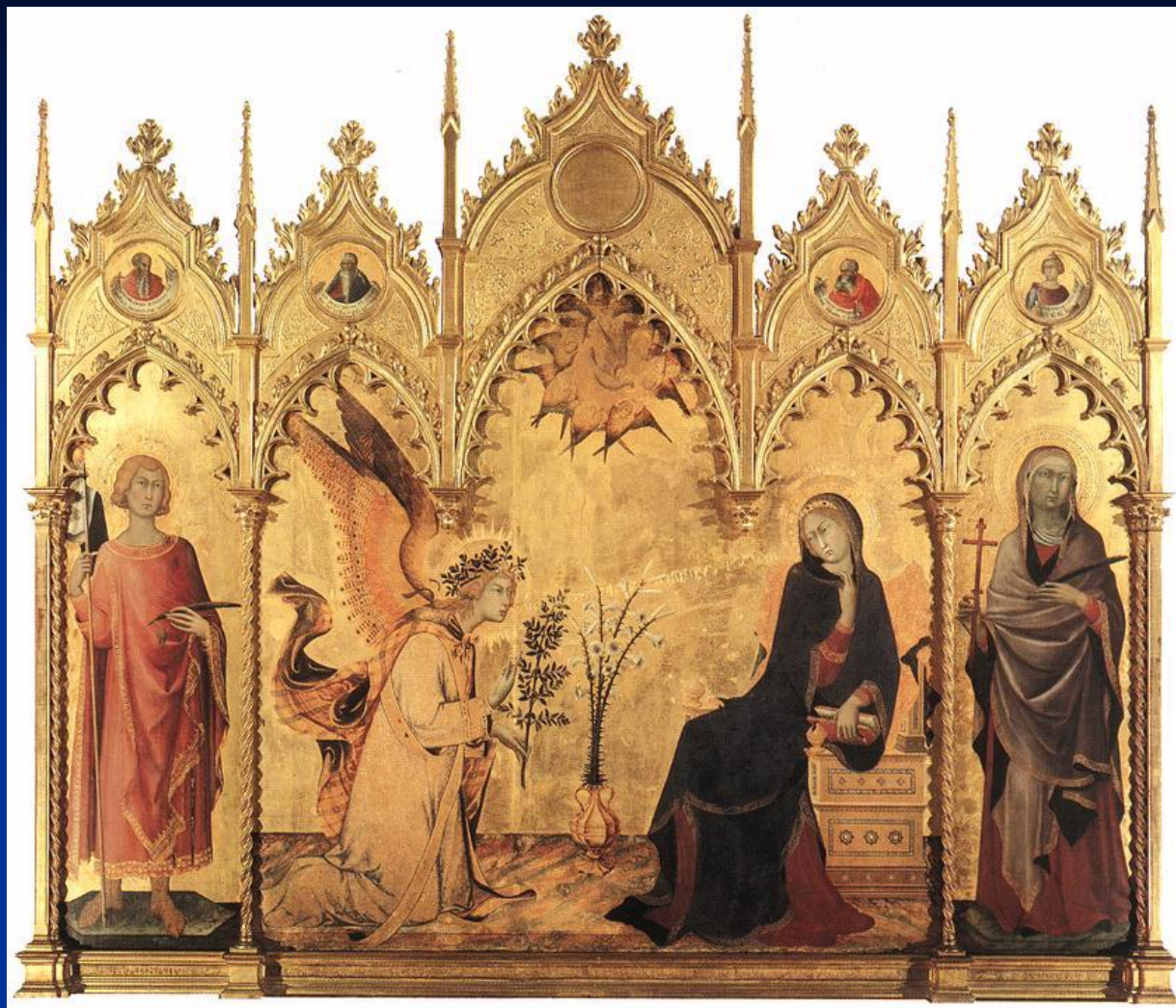
Симоне Мартини . Благовещение. 1333. Уффици, Флоренция