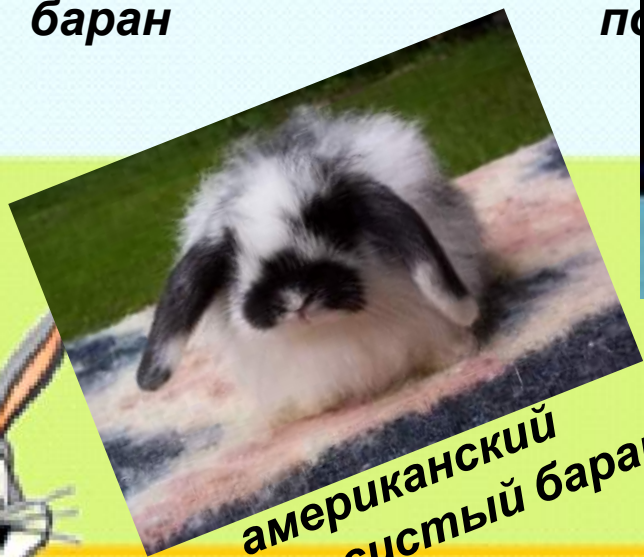
американский ворсистый баран