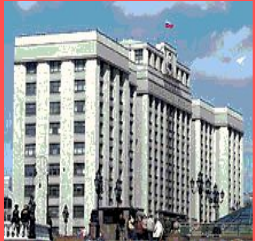
Москва. Здание Государственной думы Российской Федерации