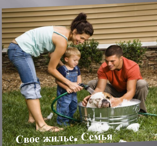
Свое жилье. Семья