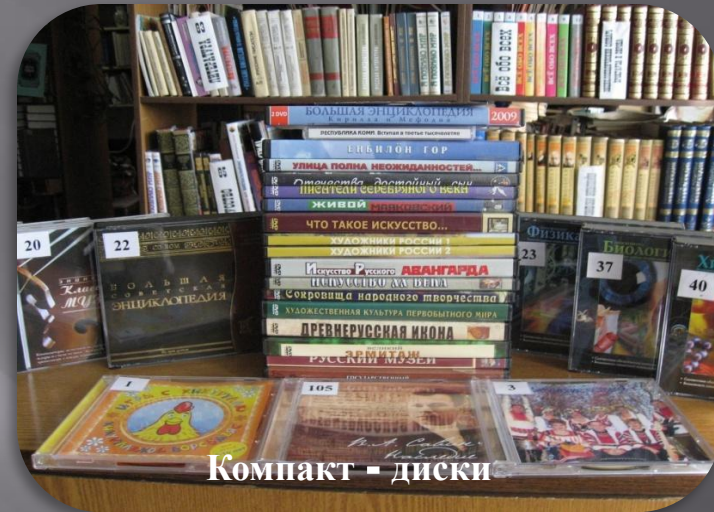
Компакт - диски