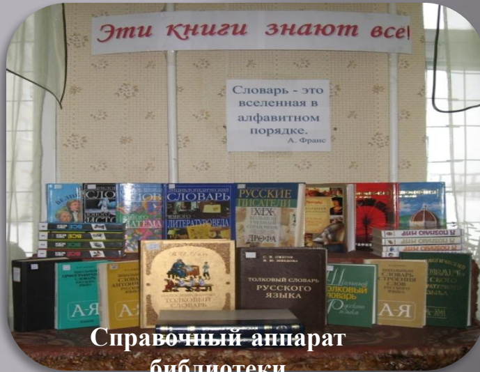
Справочный аппарат библиотеки