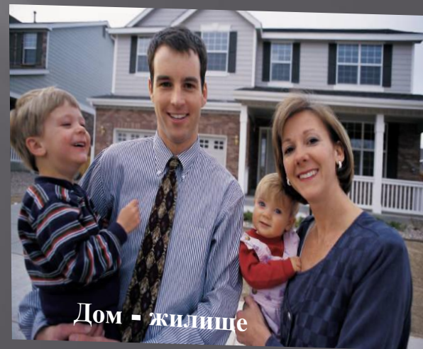
Дом - жилище