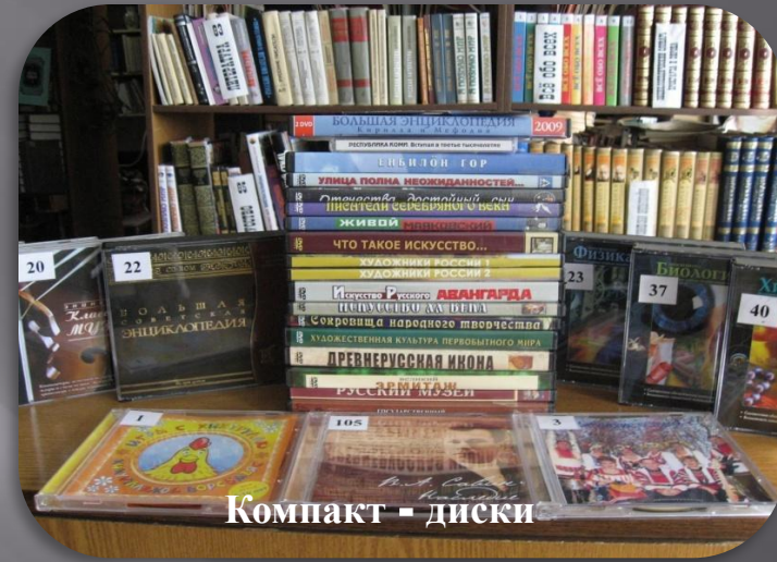
Компакт - диски