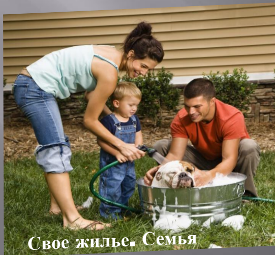
Свое жилье. Семья