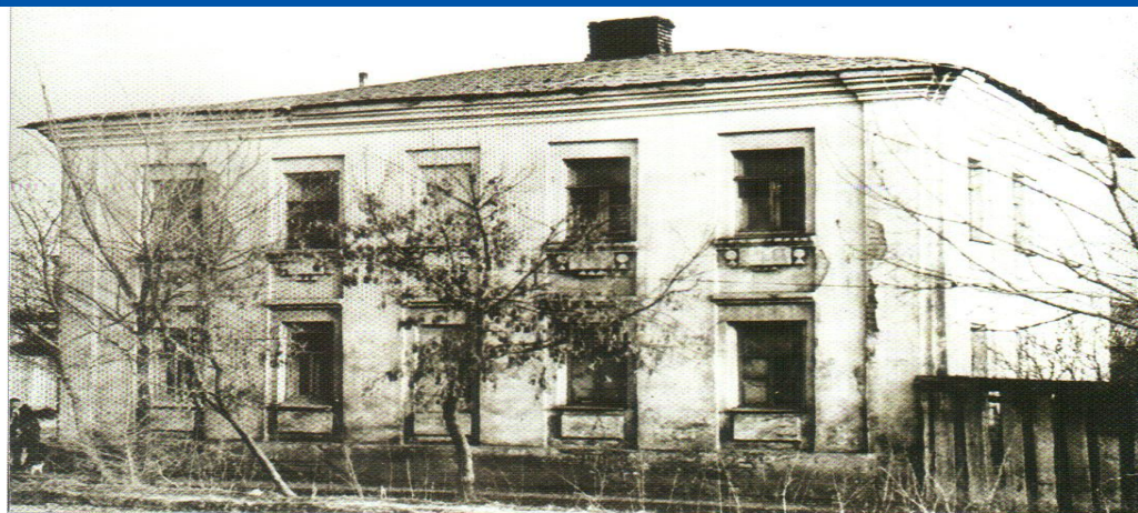
1895–1898 елларда Г.Тукай укыган өч сыйныфлы рус мәктәбе бинасы. 1960 еллардагы фоторәсем