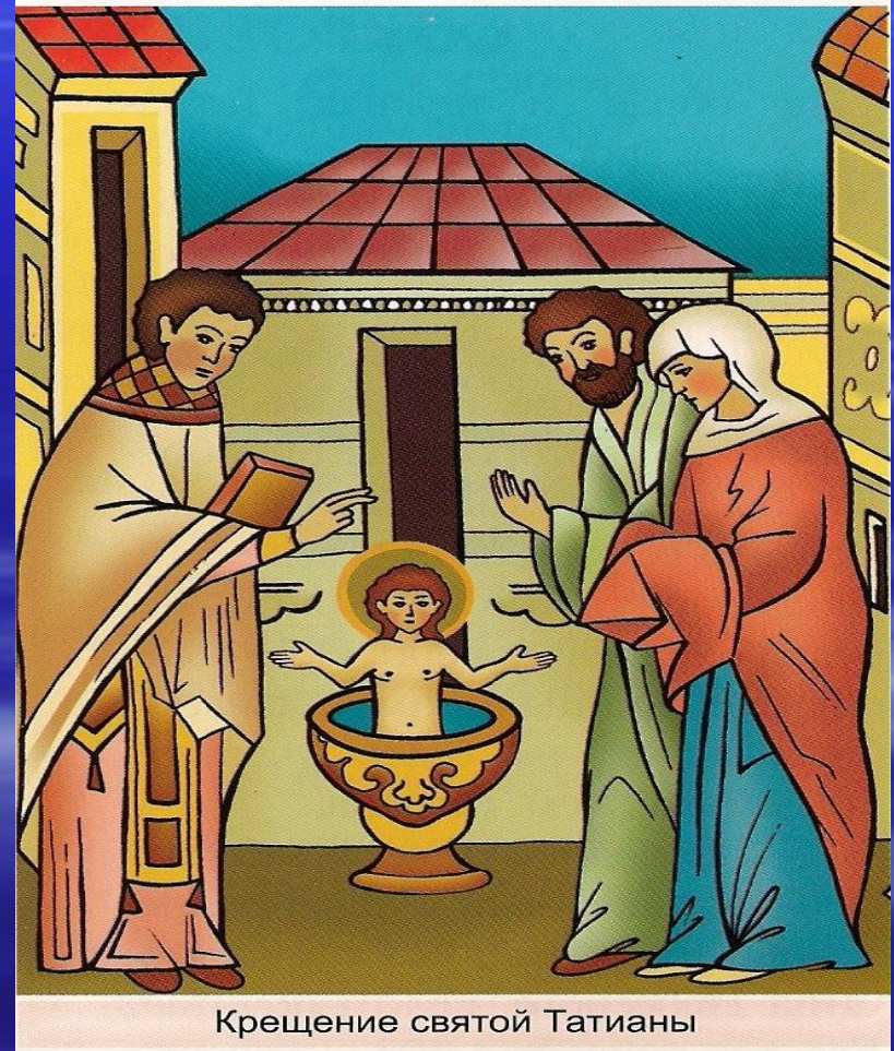
Крещение святой Татианы