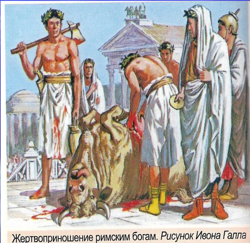
Жертвоприношение римским богам. Рисунок Ивона Галла