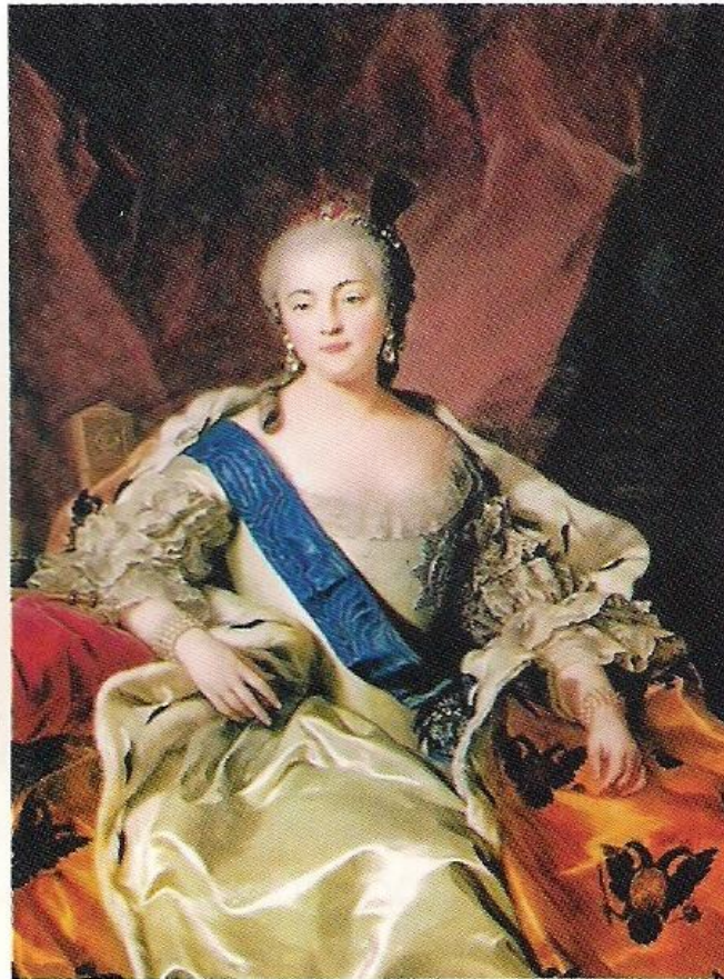
Российская императрица Елизавета Петровна