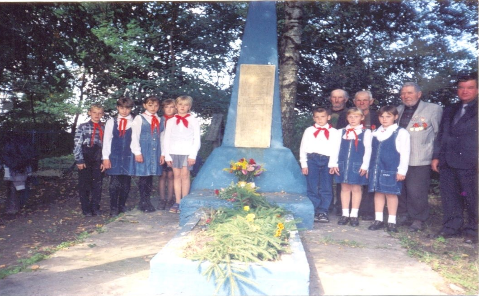
Памятник воинам и партизанам в д. Верхние Новосёлки