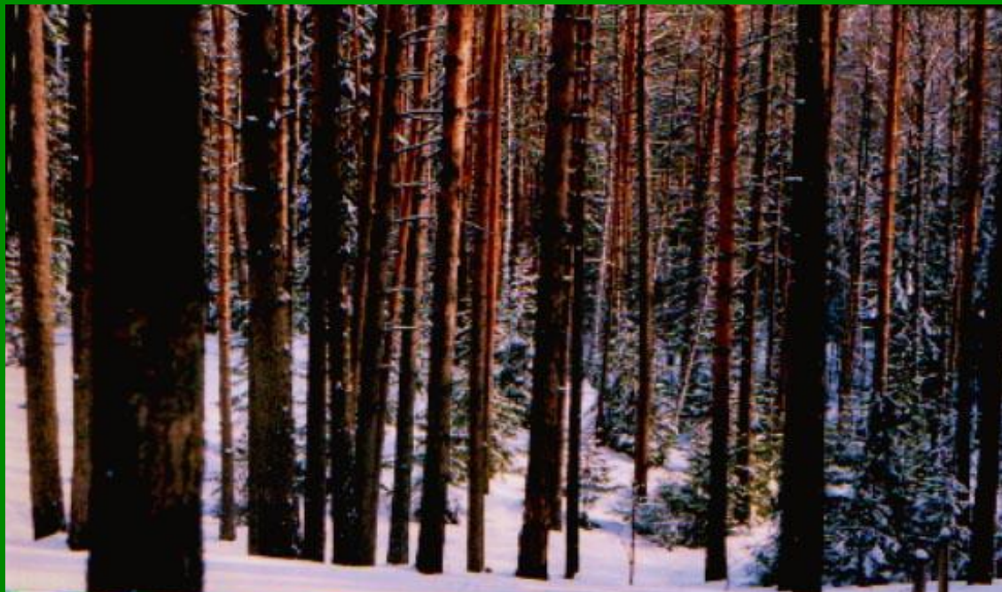
МОУ "Красногорская СОШ №2" Марий Эл, п.

В рельефе преобладают равнины, хотя их поверхность разная на западе и востоке территории парка. В западной её части равнины сложены мощной толщей песчаных отложений, нанесенных реками и талыми водами ледника.