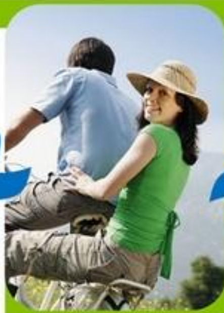
Активный образ жизни