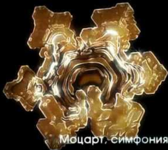
Моцарт, симфония №40