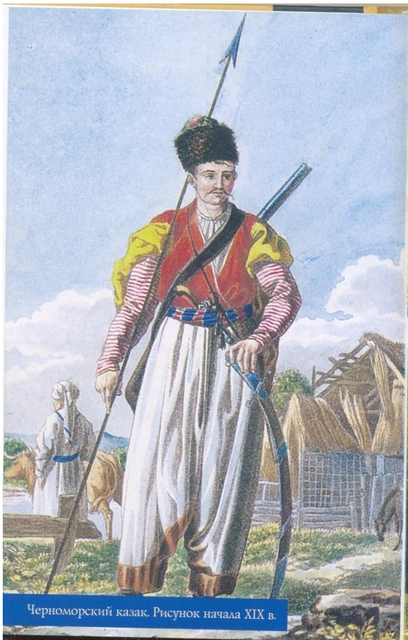
Черноморский казак. Рисунок начала XIX в.