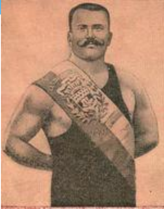
Иван Поддубный В начале XX века этого тяжелоатлета называли самым сильным человеком планеты