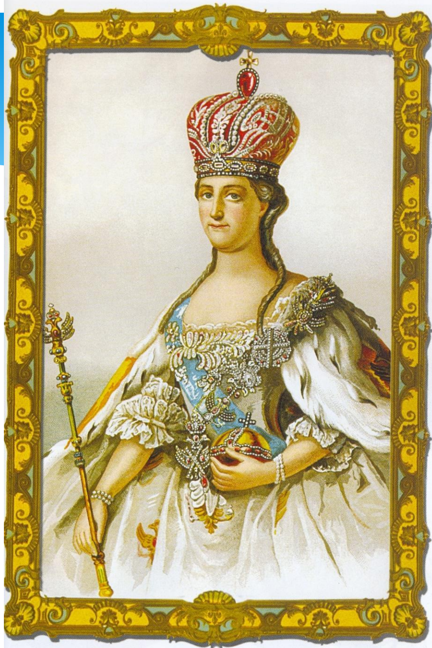
Императрица Екатерина II