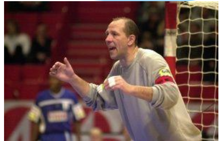
Андрей Лавров Гандболист, участник пяти Олимпиад, трехкратный олимпийский чемпион.