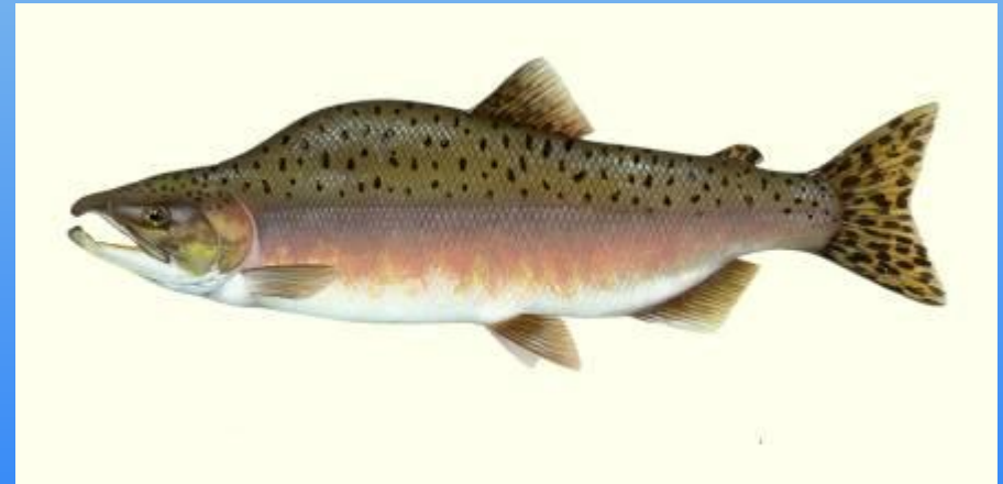
самец в брачный период