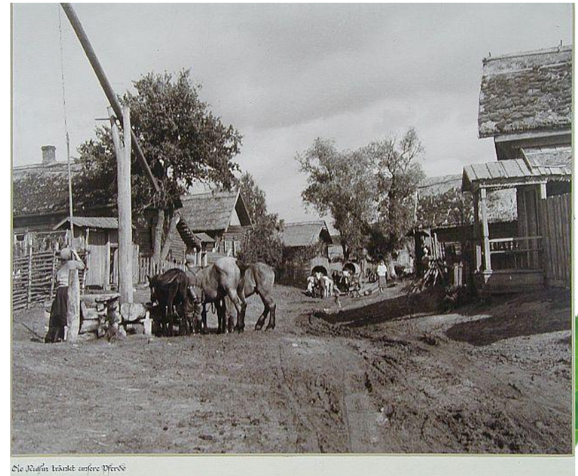
Не Раффиса вканикә әнфәре Үҗәре