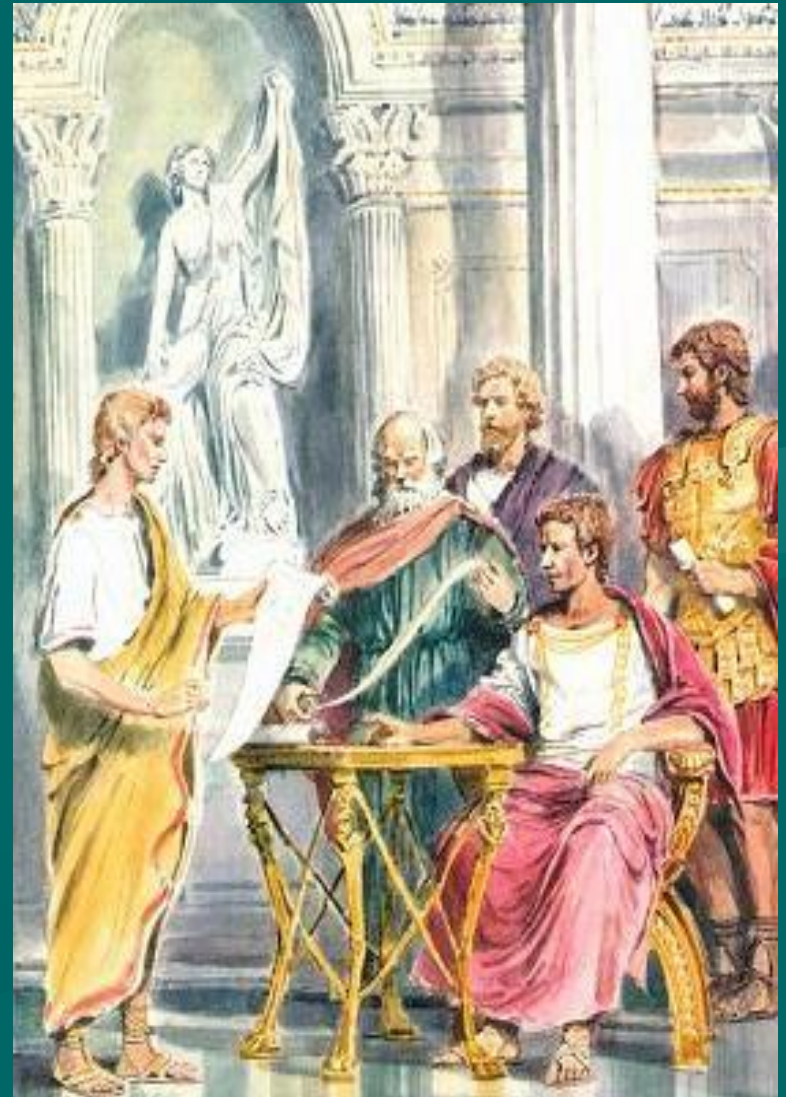
Созиген показывает Юлию Цезарю новый календарь

Названный в честь римского императора Юлия Цезаря . «юлианский» год имеет среднюю длину 365 суток. Однако между истинным солнечным годом и юлианским годом существует заметное расхождение. Истинный солнечный год длится 365 дней 5 часов и 49 минут, так что юлианский год оказался немного длиннее. Вначале на эту неточность не обращали внимания, но постепенно начало весны в календаре все больше смещалось к февралю. В XVI веке астрономическая весна началась не 21, а 11 марта. Необходимо было задуматься о новой реформе календаря!