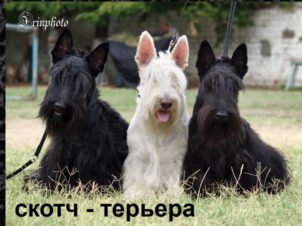
скотч - терьера