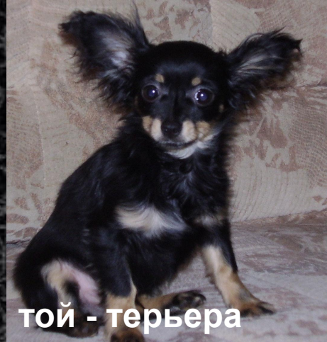
той - терьера