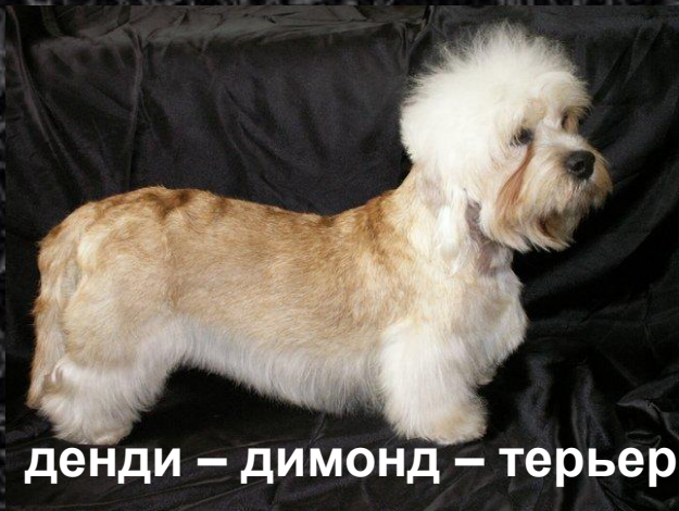
денди – димонд – терьер