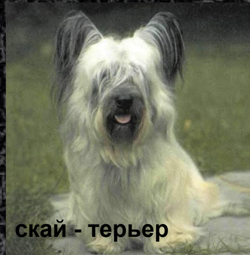
скай - терьер