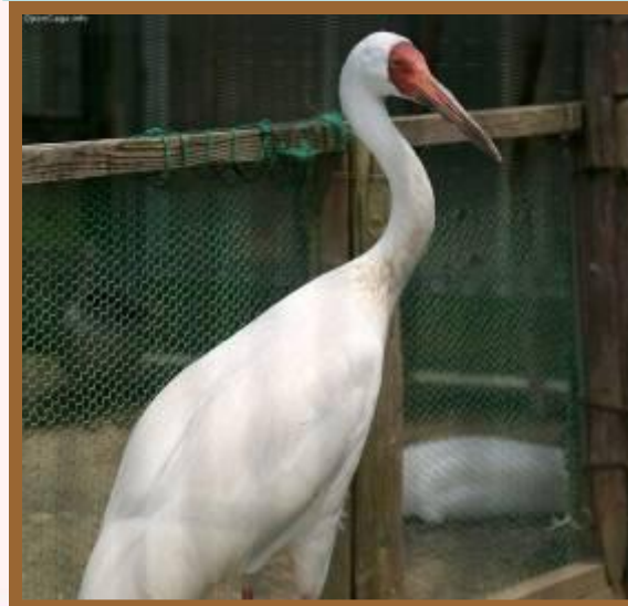
Белый журавль (стерх)