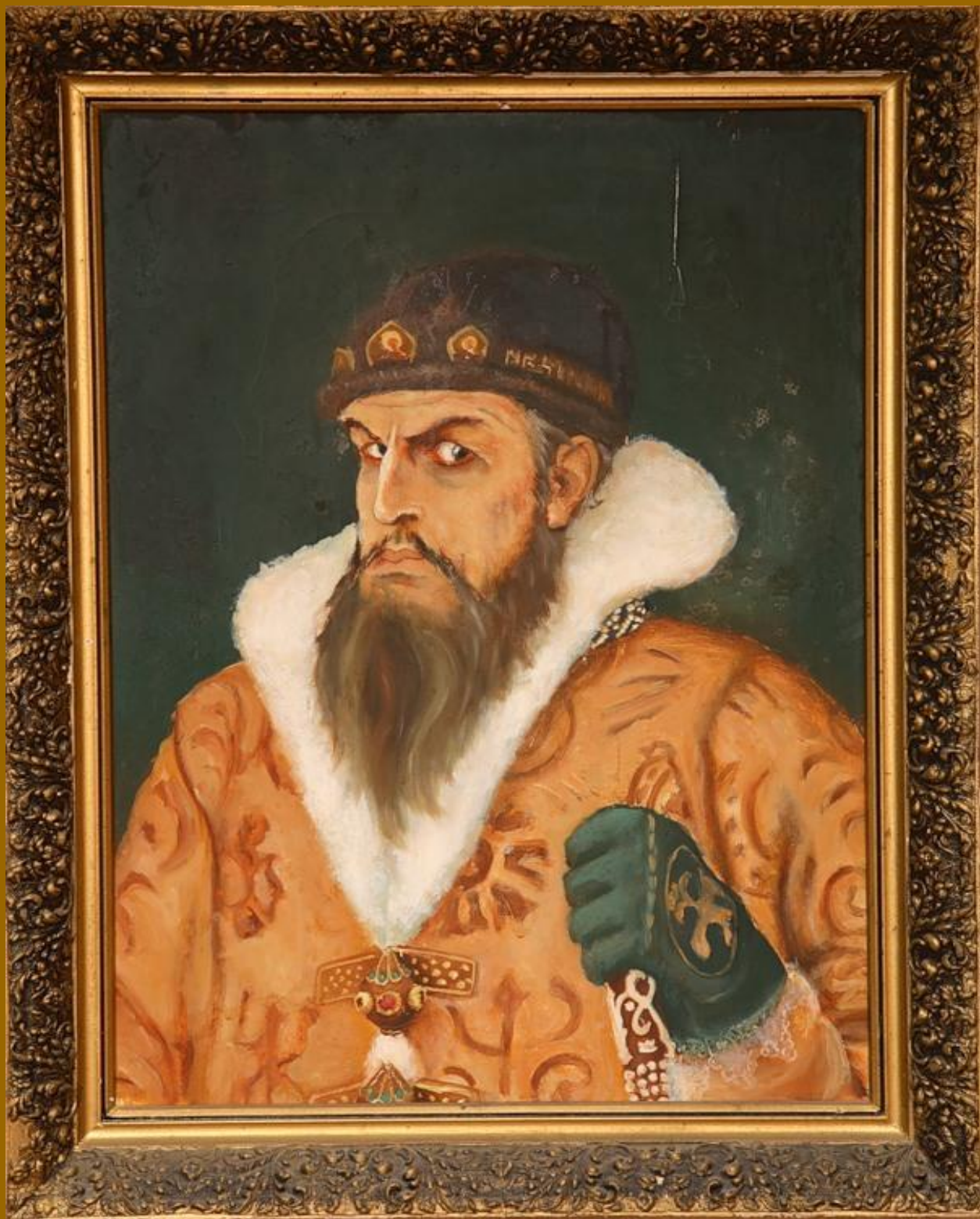
Иван IV Грозный