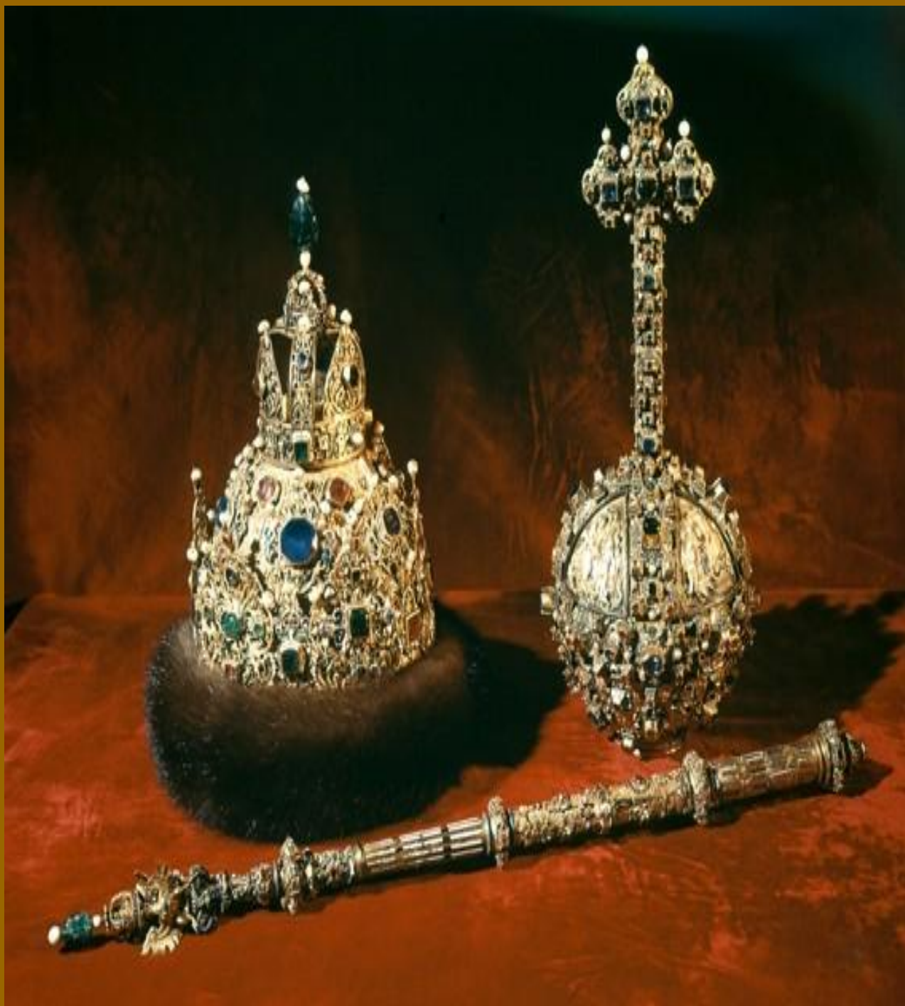
Шапка Мономаха, скипетр и держава