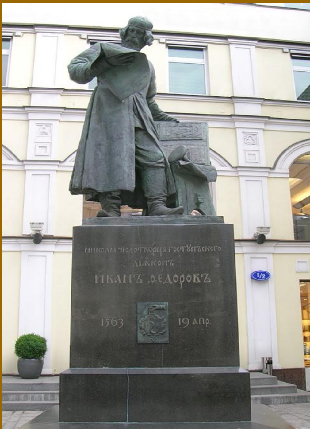
Памятник первопечатнику Ивану Фёдорову