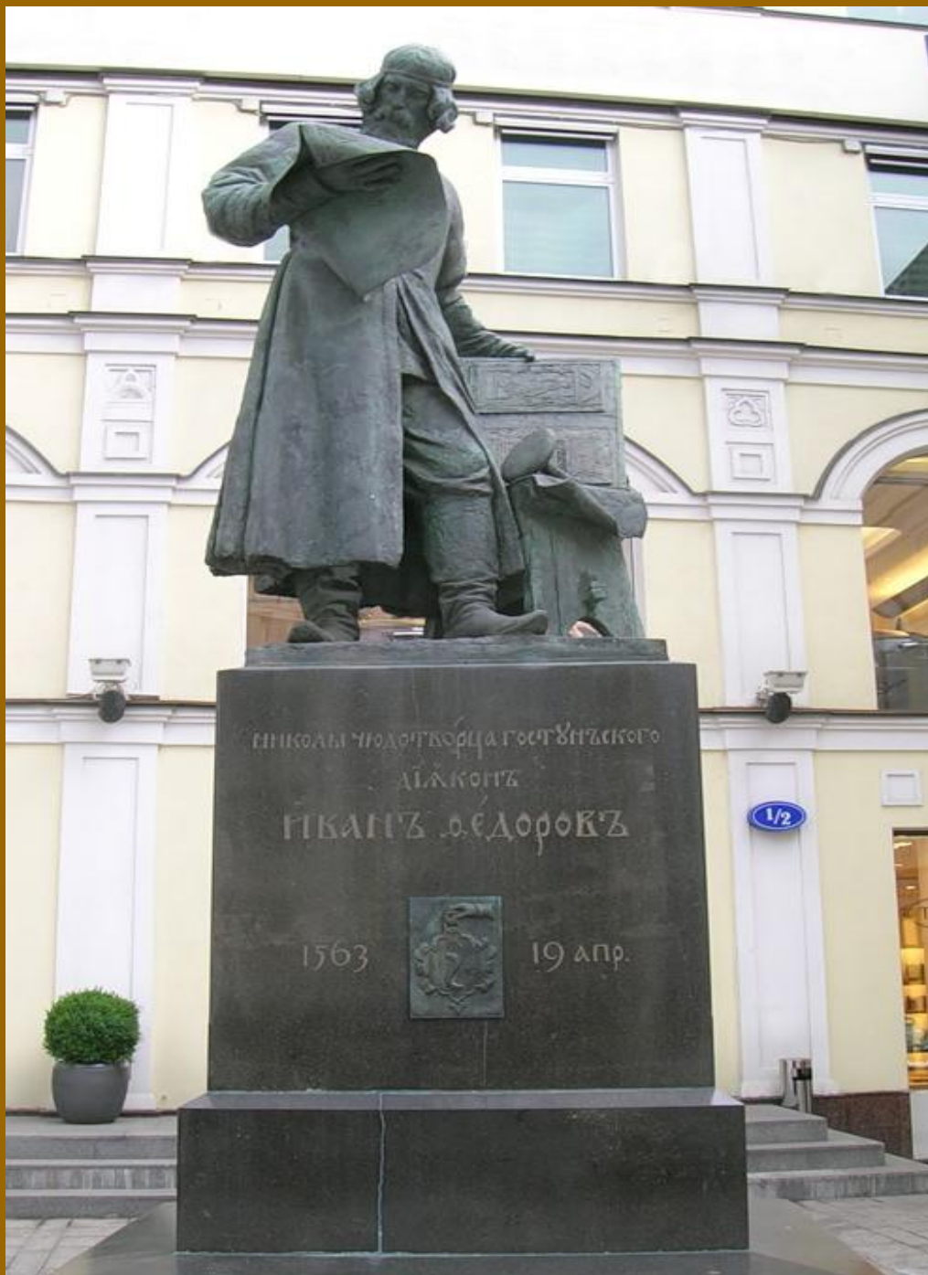
Памятник первопечатнику Ивану Фёдорову