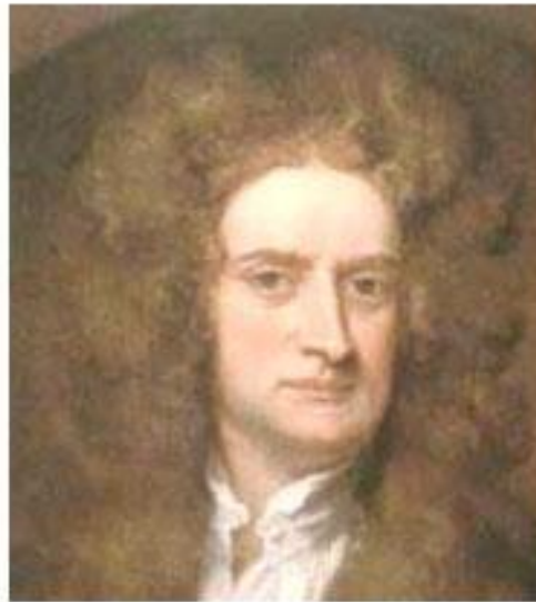
Исаак Ньютон (1642-1727)

В Англии жил великий ученый Ньютон. Однажды осенью гуляя по саду он увидел как с ветки упало яблоко. Он первым понял, что яблоко притянула Земля. Так был открыт закон всемирного тяготения.