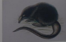
Выхухоль Desmana moschata Linnaeus