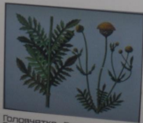
Голозачатка Литвинова Cerphalaria litvinavii СЕМЕЙСТВО ВОРСЯНКОВЫЕ