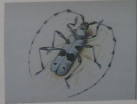
Усач альпийский Rosalia alpina ОТРЯД ЖЕСТКОКРЫЛЫЕ СЕМЕЙСТВО УСАЧИ