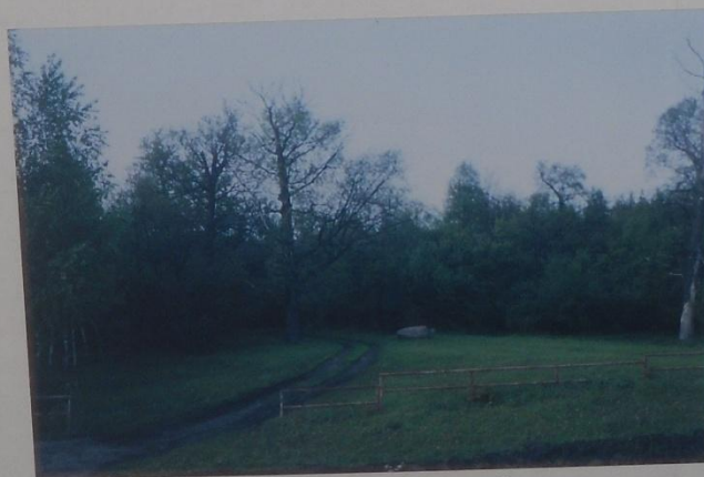
ПАМЯТНИК ПРИРОДЫ БЕЛИНСКИЙ ЛЕС