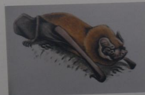
Гигантская вечерница Nyctalus lasiopterus Schreber ОТРЯД РЫКОКРЫЛЫЕ СЕМЕЙСТВО ПЯДКОНОСЫЕ