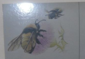
Шмель армянский Bombus armeniacus Radzskowski ОТРЯД ПЕРЕПОНЧАТОКРЫЛЫЕ СЕМЕЙСТВО ПЧЕЛЫ