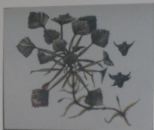
Водяной орех Чилим Trapa natans СЕМЕЙСТВО ТРАПАСЕЕ