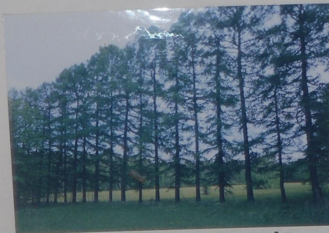
ПАМЯТНИК ПРИРОДЫ УРОЧИЩЕ „ШУГАЙ“