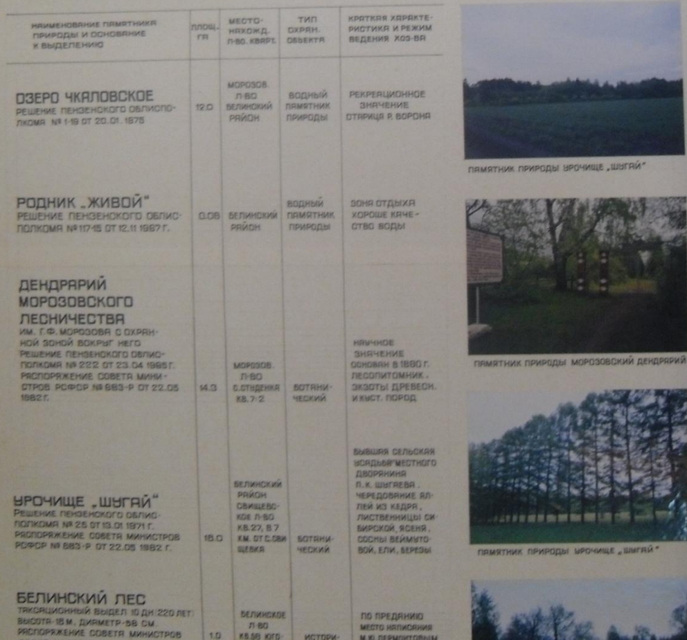
ПАМЯТНИК ПРИРОДЫ УРОЧИЩЕ „ШЫГАЙ“

СПЕЦИАЛЬНЫМИ РЕШЕНИЯМИ ПЕНЗЕНСКОГО ОБЛИСПОЛКО - МА РАЗНЫХ ЛЕТ НА ТЕРРИТОРИИ ПРЕДПРИЯТИЯ ПАМЯТНИКАМИ ПРИРОДЫ ОХРАНЯЕМЫМИ ГОСУДАРСТВОМ ОБЪЯВЛЕНЫ: