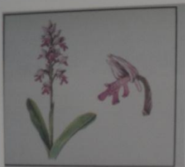
Ятрышник шлемоносный Orchis militaris СЕМЕЙСТВО ЯТРЫШНИКОВЫЕ