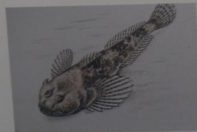
Обыкновенный подкаменщик Cottus gobio Linnaeus ОТРЯД СКОРПЕНООБРАЗНЫЕ СЕМЕЙСТВО КЕРЧАКОВЫЕ