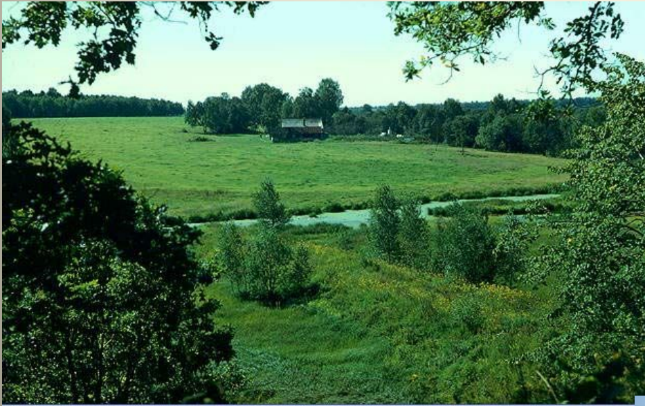
Русская равнина. Река Пра в Мещере.