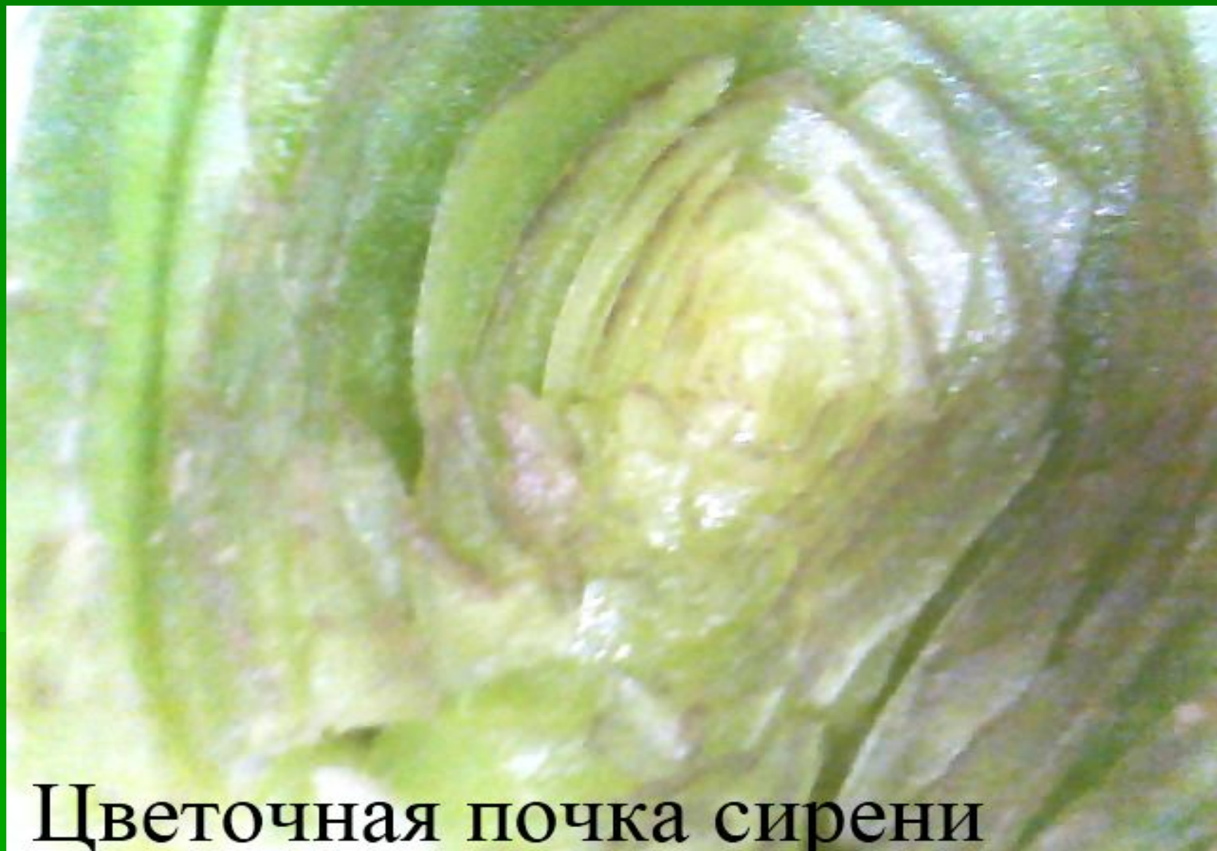
Цветочная почка сирени