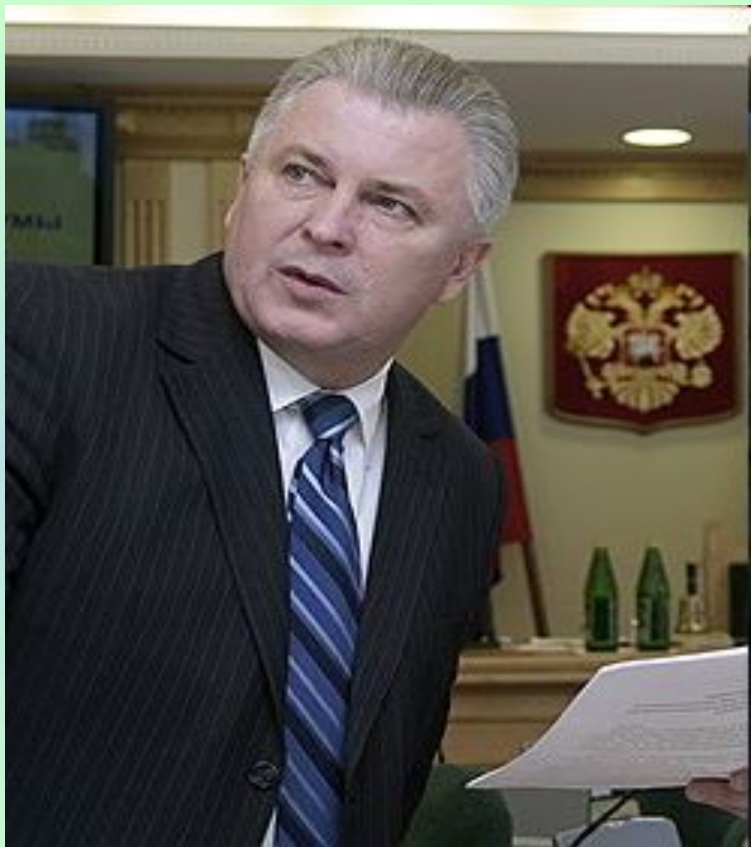
Президент Республики Бурятия- Ноговицын В.В.