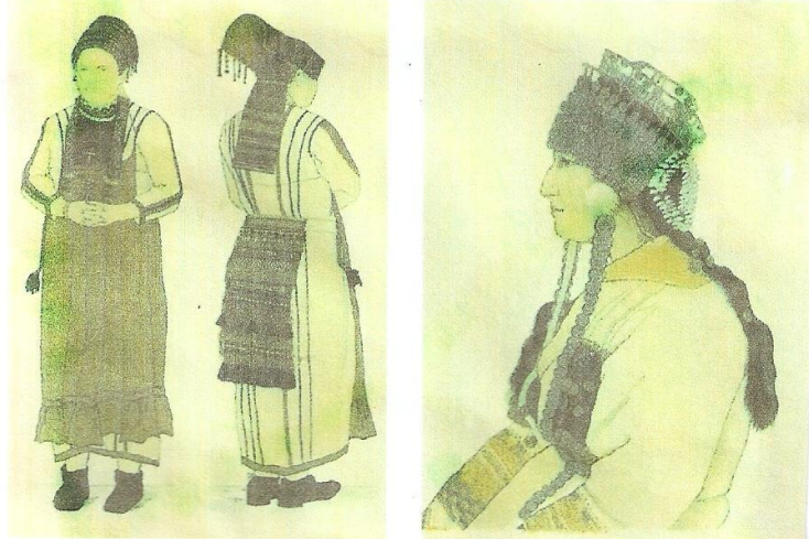
Мордовский женский национальный костюм