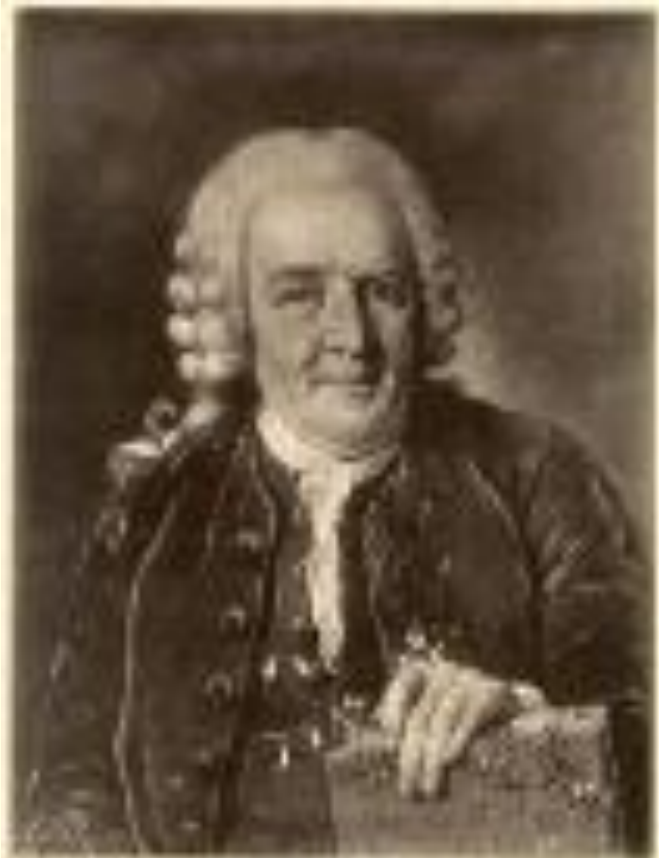
Carl Linnaeus 1707-1778