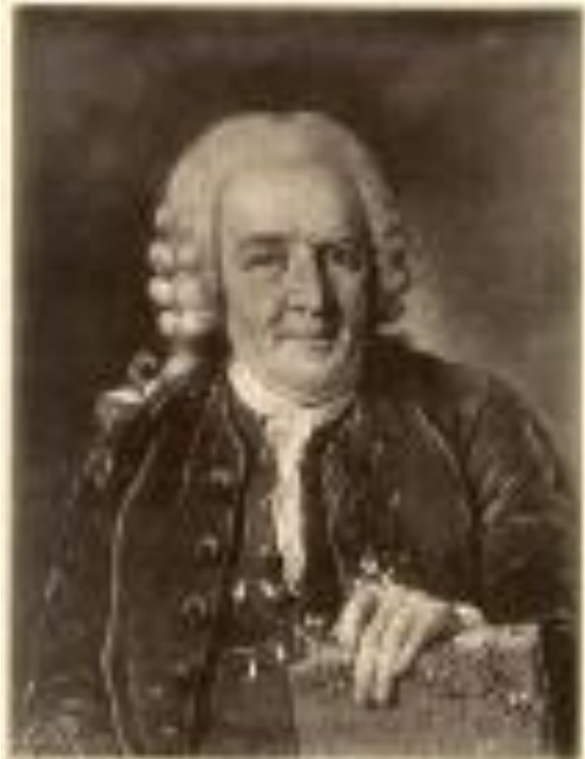
Carl Linnaeus 1707-1778