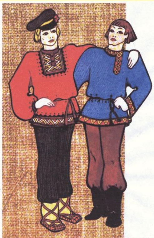
МУЖСКОЙ КРЕСТЬЯНСКИЙ КОСТЮМ (РУБАХА И ПОРТЫ)