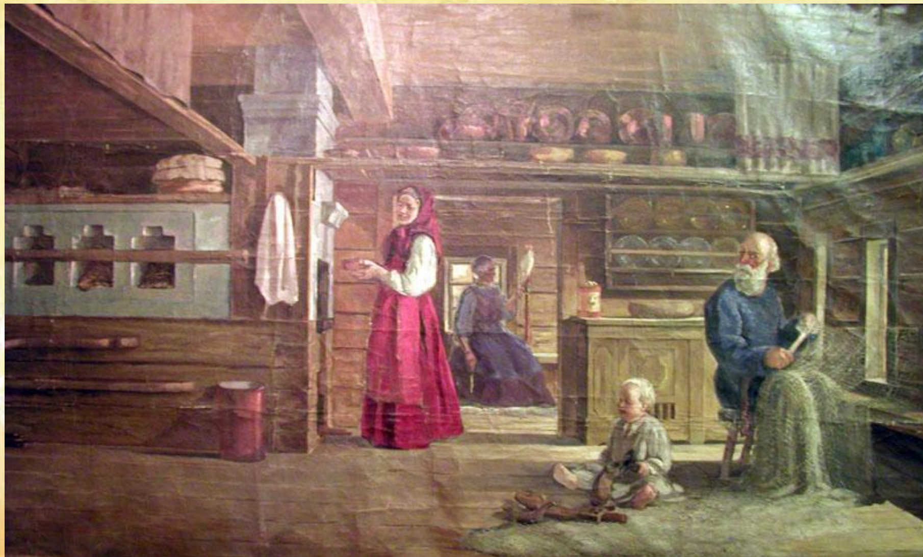
"Быт поморской семьи 18 в." художник Румянцев А. Я.