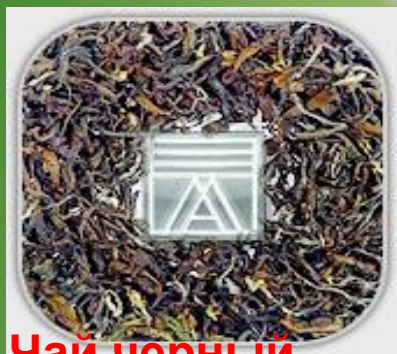
Чай черный листовой .