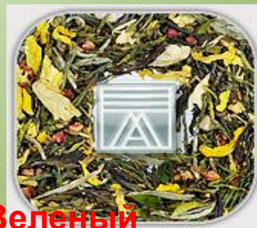
Зеленый ароматизированный листовой чай.