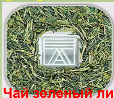
Чай зеленый листовый