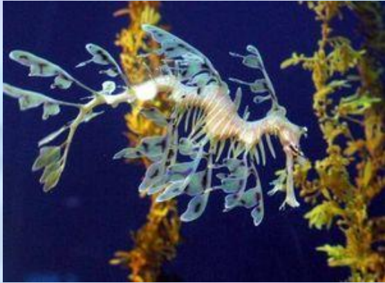
Лиственный морской дракон

Какое животное изображено на официальной эмблеме штата Южная Австралия. Отростки его, похожие на листья, служат ему для маскировки.