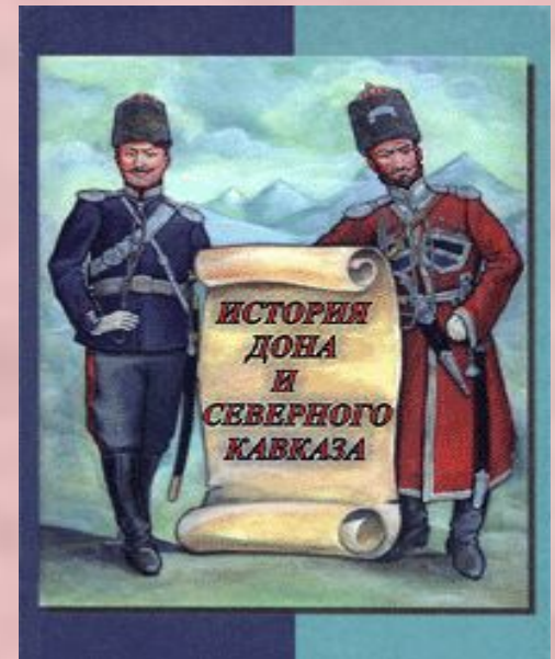
Дон и Кавказ