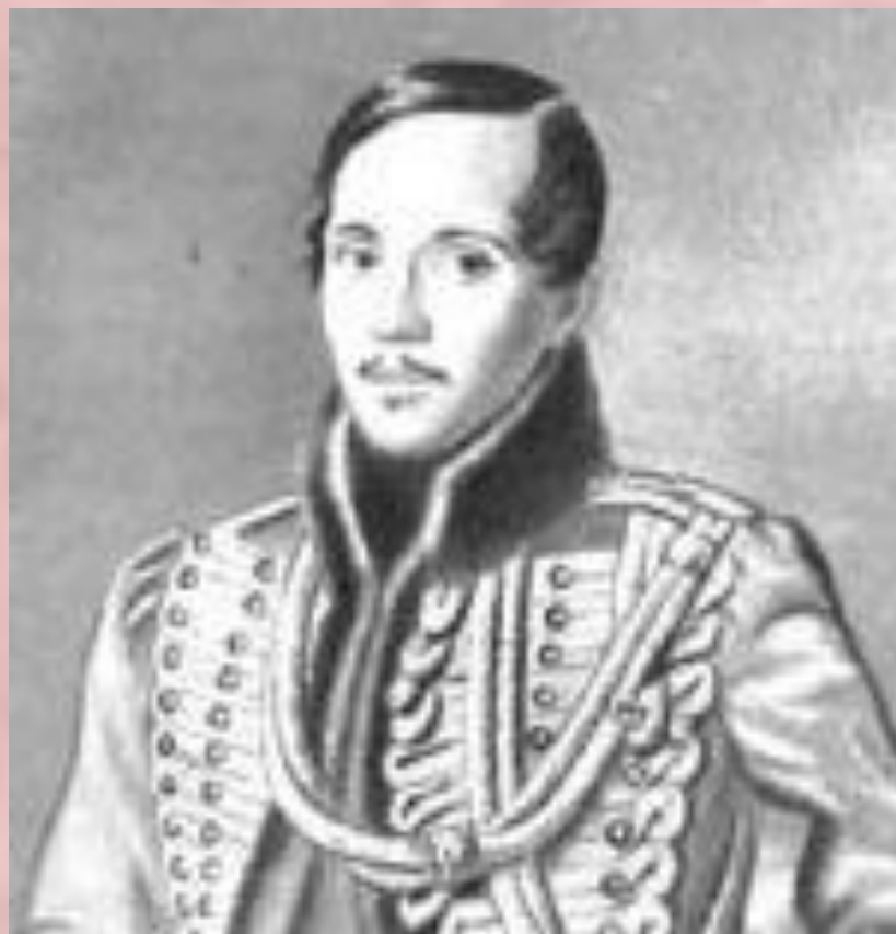
М. Ю. Лермонтов