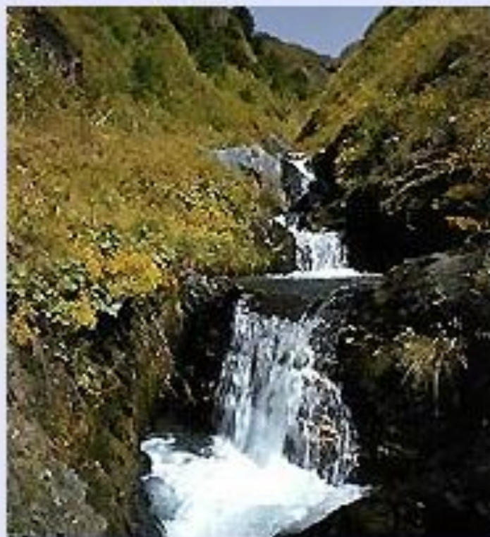
В Закатальском заповеднике.