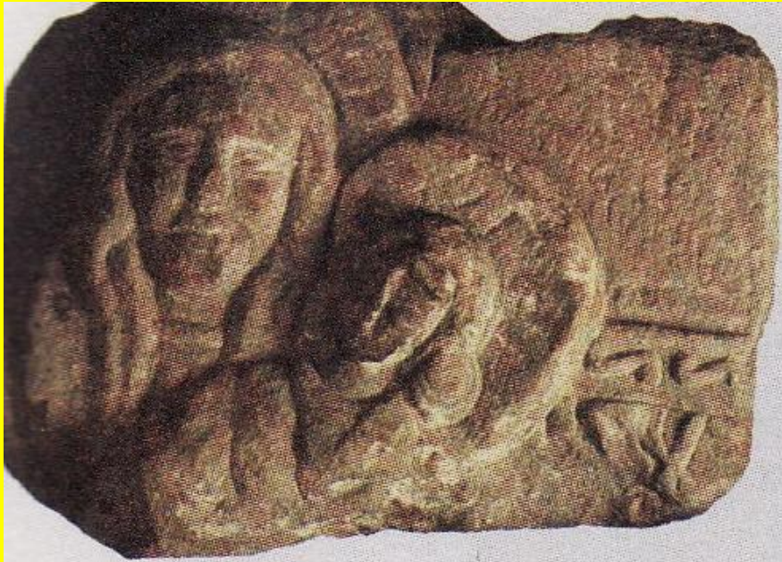
Рельеф с изображением Богородицы из раскопок около Десятинной церкви Фрагмент. Киев