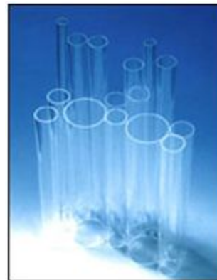
стеклянные лабораторны й