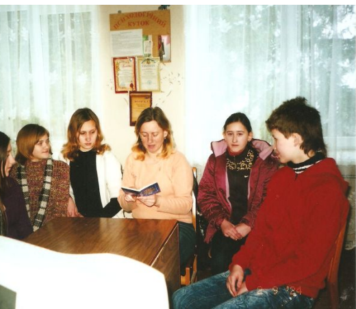
Круглий стіл “Дитина та її права