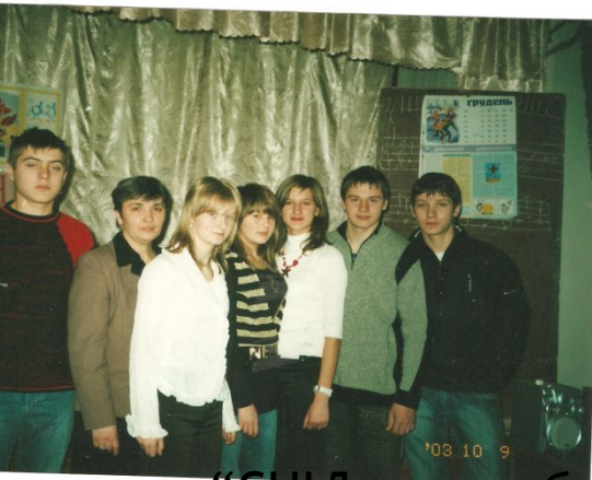
1 година “СНІД - хвороба