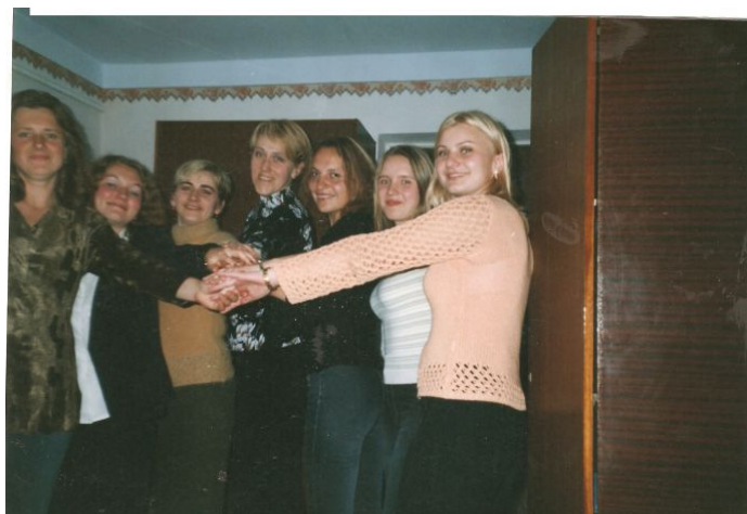
Тренінг з педагогами по спілкуванню