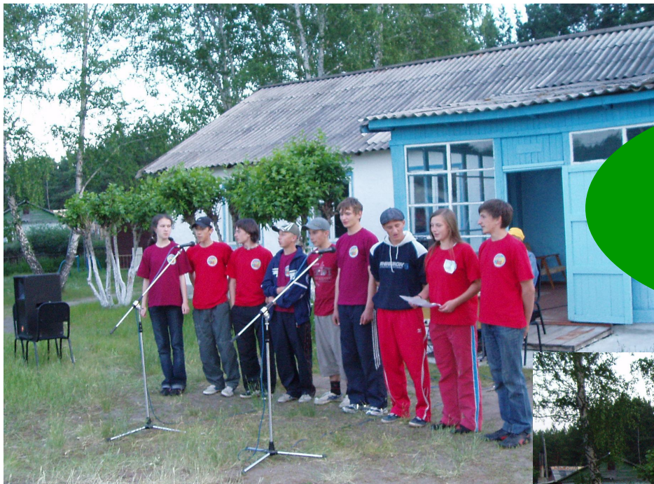
Команда МОУ «Иртышская СОШ»