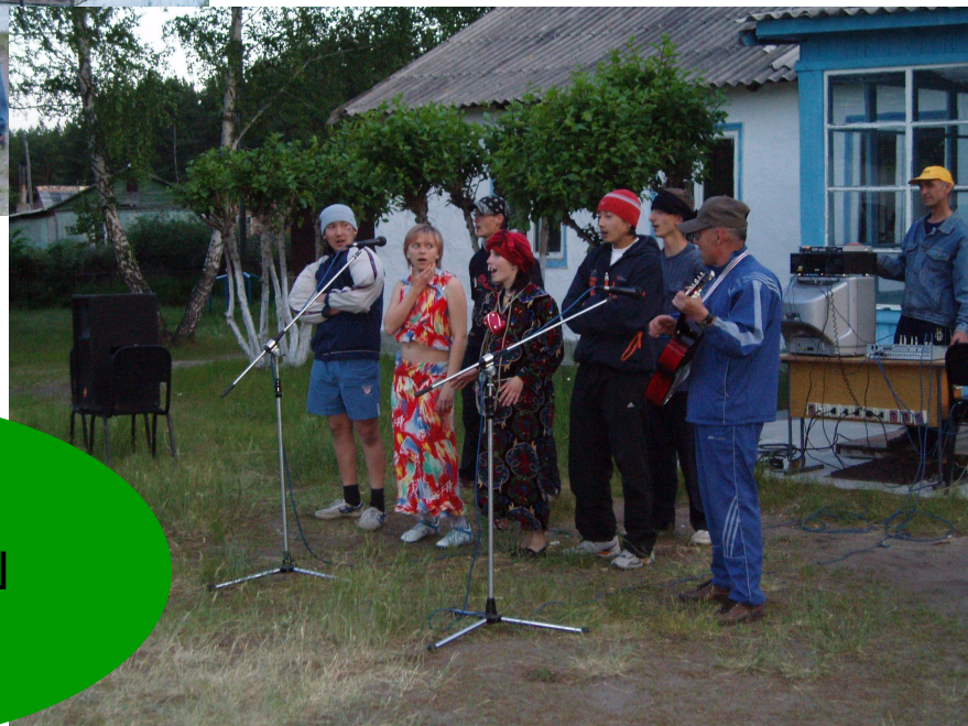
Команда МОУ «ЧСОШ №1»