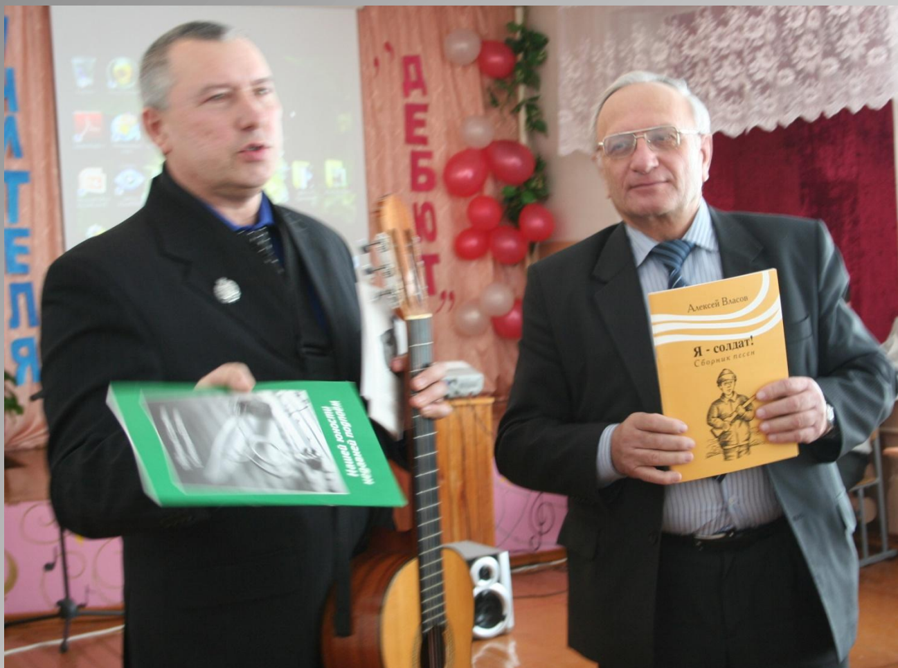
Мастер-класс проводят обладатели премии Губернатора Алтайского края им. С. П. Титова