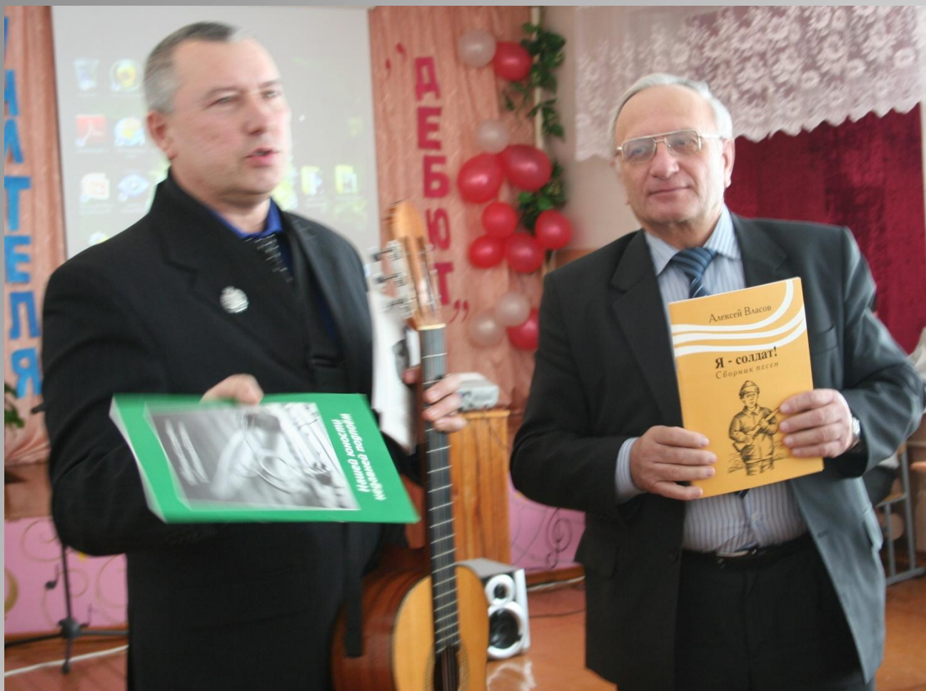
Мастер-класс проводят обладатели премии Губернатора Алтайского края им. С. П. Титова